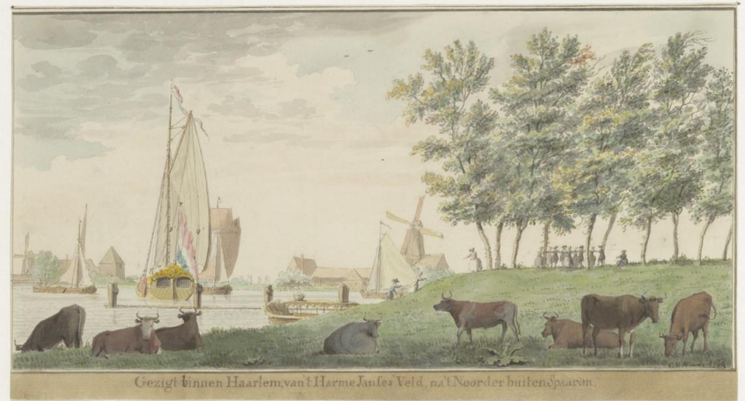
NL-HlmNHA_53001020_K ; C. van Noorde, 1764 ; Spaarne, oostoever pal ten noorden van de spoorbrug ong. t.p.v. het huidige stadsstrand De Oerkap. Ook ong. t.p.v. een kleine eeuw eerder de tuin, buitenhuis, tekenschool en steenwerf van Romeyn de Hooghe. In 1764 onderdeel van het Harmen Jansveld. Gezicht richting noord op het Noorder Buiten Spaarne. In het midden van het water de Noorderboom. Het talud rechts van het midden is de binnenkant van het geheel verdwenen bolwerk aldaar.

De poort heeft vele verschillende namen gehad: Vrouwehek, ook geheten Goe(de) Vrouwehek, Amsterdamsche Waterpoort of Friese Hek. De namen Vrouwehek of Goe Vrouwehek stammen mogelijk af van een algemeen uithangteken "de GoeVrou" of "het vrouwtje zonder hoofd". De oostelijke toren van de Catharijnepoort heette Goe Vroutoren. Momenteel staat hier bovenop de Adriaan. De naam Friese hek houdt verband met de naam van de spaarneoever ten zuiden van het Vrouwehek: nl. Friese Varkensmarkt(Fries staat hier voor West Friesland). Het Vrouwehek was een zeer eenvoudige doorgang, die moet dateren uit de tijd van de bouw van de vestingwerken in de zeventiger jaren van de 17 e eeuw(1672 ?). Verder is er eigenlijk geen informatie te vinden over het Vrouwehek. De sloopdatum valt niet te achterhalen. Het lijkt logisch, dat het verdwenen is bij de