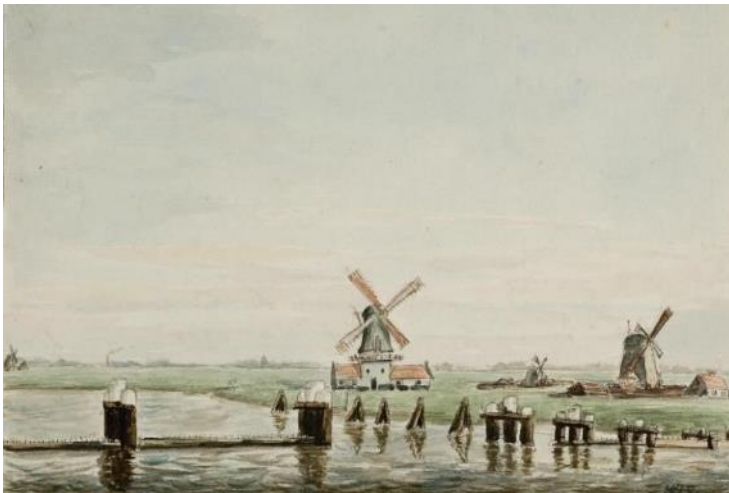
NL-HlmNHA_53001072_K ; W.J. Boogaard ; 1855 ; Van l.n.r. : Jonge Willem(Waardermolen), De Hoop of Anker, poldermolen De Veer en paltrokmolen(houtzaagmolen) De Keyzer, Op de voorgrond de Noorderboom

Ten noordoosten van de poort lag de Noorderboom in het Spaarne. Deze liep vanaf de singelkant van de brug van het Vrouwehek naar de andere kant van het water. Hierdoor werd de doorvaart opening verkleind en tegelijk met het openen en sluiten van de landpoorten kon deze nauwe opening ook geopend en gesloten worden. Hiervoor had men ook een luidklok. Volgens HaarlemsDagblad werd in 1866 de Noorderboom verwijderd en was de luidklok ook niet meer nodig. Over de Noorderboom is nul komma nul informatie te vinden, terwijl hij net zo belangrijk was als een landpoort. Als ik de sloopdata van overige muren en poorten in oenschouw nemen is de Noorderboom mogelijk al een aantal jaren eerder dan 1866 verdwenen. Wel is de Noorderboom terug te vinden op een aantal 18 e eeuwse tekeningen van Cornelis van Noorde. Zie bibliografie (Sliggers, 1982).