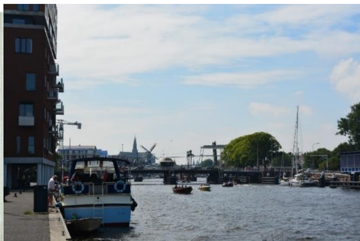
DSC_00016391 ; AV ; 22-7-2018 ; Vergelijkbare situatie als prent links