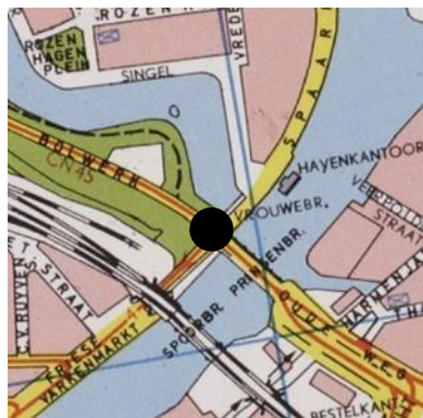
Locatie: kruising Friese Varkensmarkt/Prinsen Bolwerk