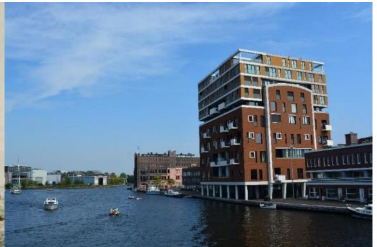
DSC_00016380 ; AV ; 22-7-2018 ; Vergelijkbare situatie als op prent links