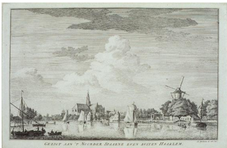
NL-HlmNHA_53000196_M ; H. Spilman ; 1762 ; Gezicht richting zuid over Noorder Buiten Spaarne