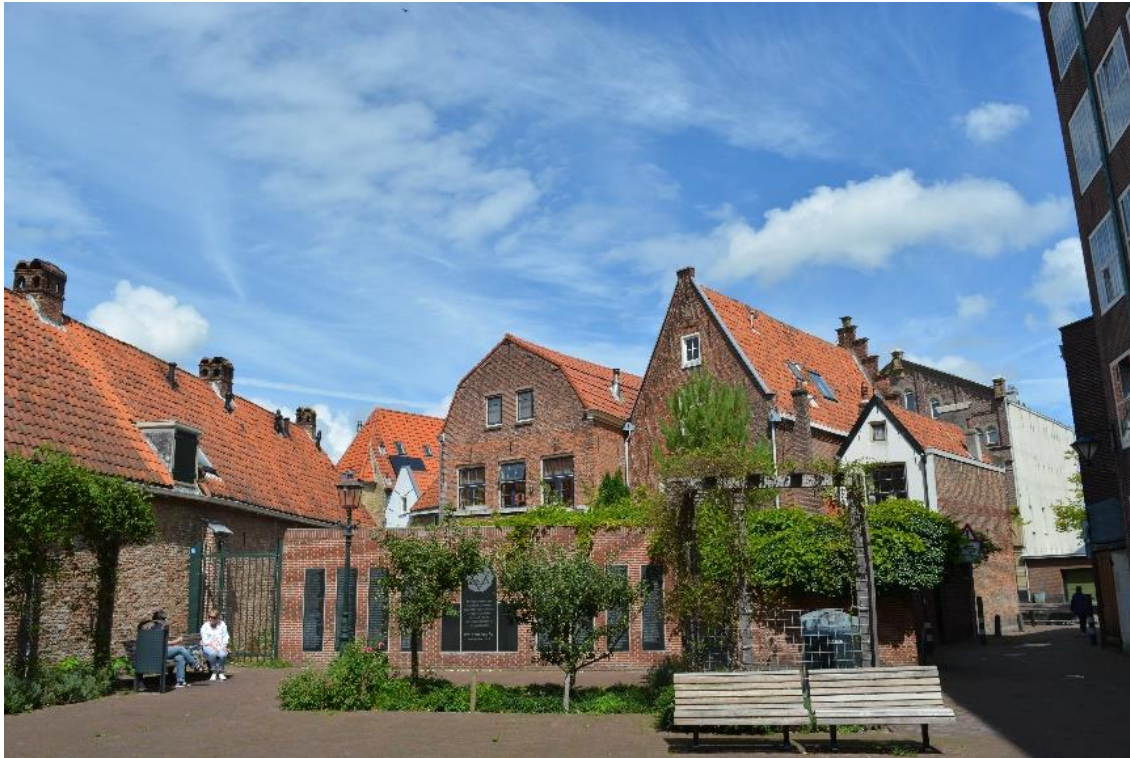
DSC_7677 ; AV ; 31-7-2017 ; Gezicht richting noordoost op het Philip Frankplein met het Joods Monument. Geheel links de zijmuur van het Bakenesserhofje.