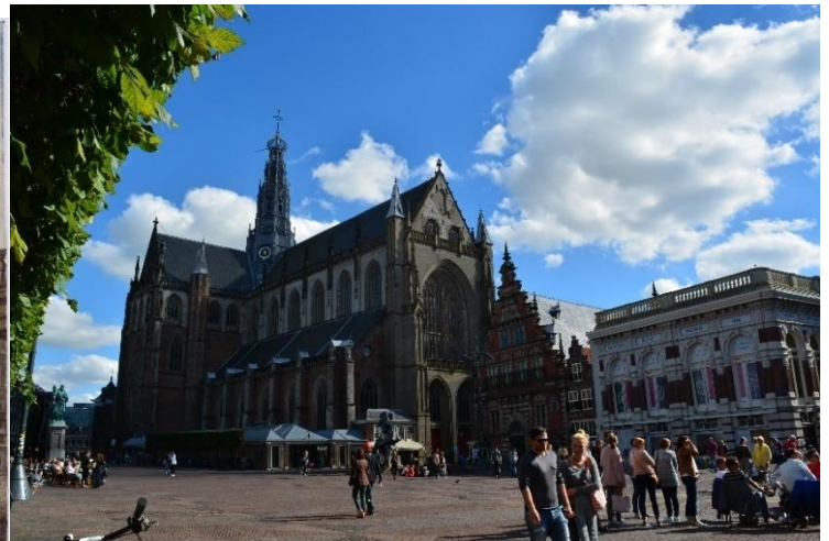
DSC_3907 ; AV ; 23-9-2016 ; Vergelijkbare situatie als op afbeelding links. Ook hier is een klein stukje van het Klokhuis op de achtergrond zichtbaar