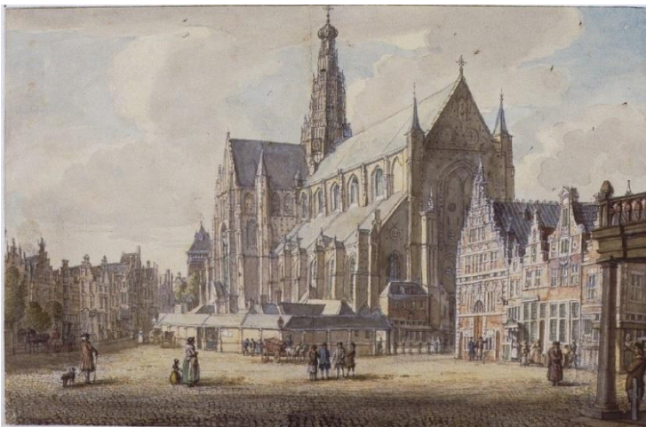
NL-HlmNHA_53000408_K ; J. de Beijer, 1751; Grote Markt met oude Vishal