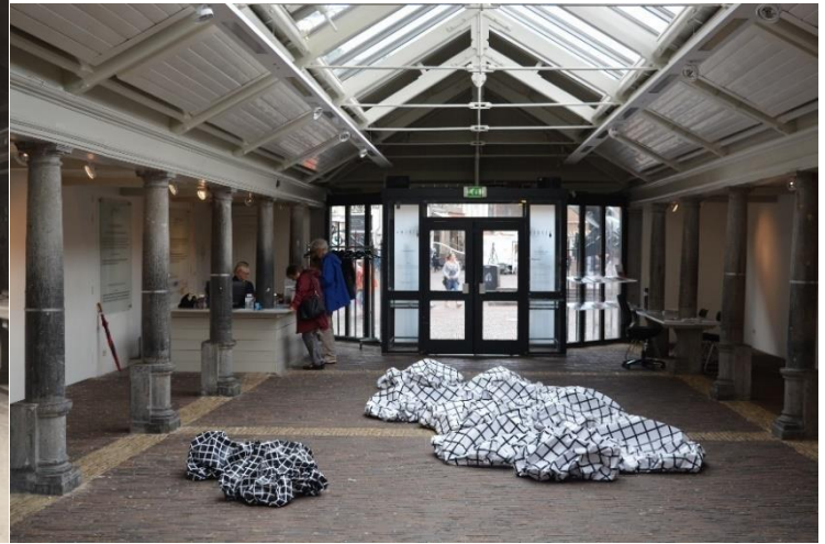
NL-HlmNHA_54018296 ; S. Engel; 1936; Nieuwe vishal functionerend als vishal