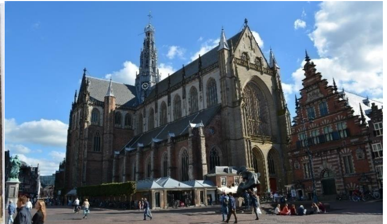
DSC_3905 ; AV ; 23-9-2016 ; Vergelijkbare situatie als op afbeelding links, zij het iets dichterbij genomen. Op bovenstaande foto en afbeelding links is het Klokhuis niet zichtbaar