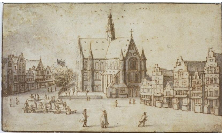
NL-HlmNHA_53001650_K J. van der Heyden; gemaakt in 1690 naar oudere prent, ca. 1525?; Oudste vorm van vishal in ca. 1525

Locatie: Grote Markt tegen noordwestzijde van Grote Kerk