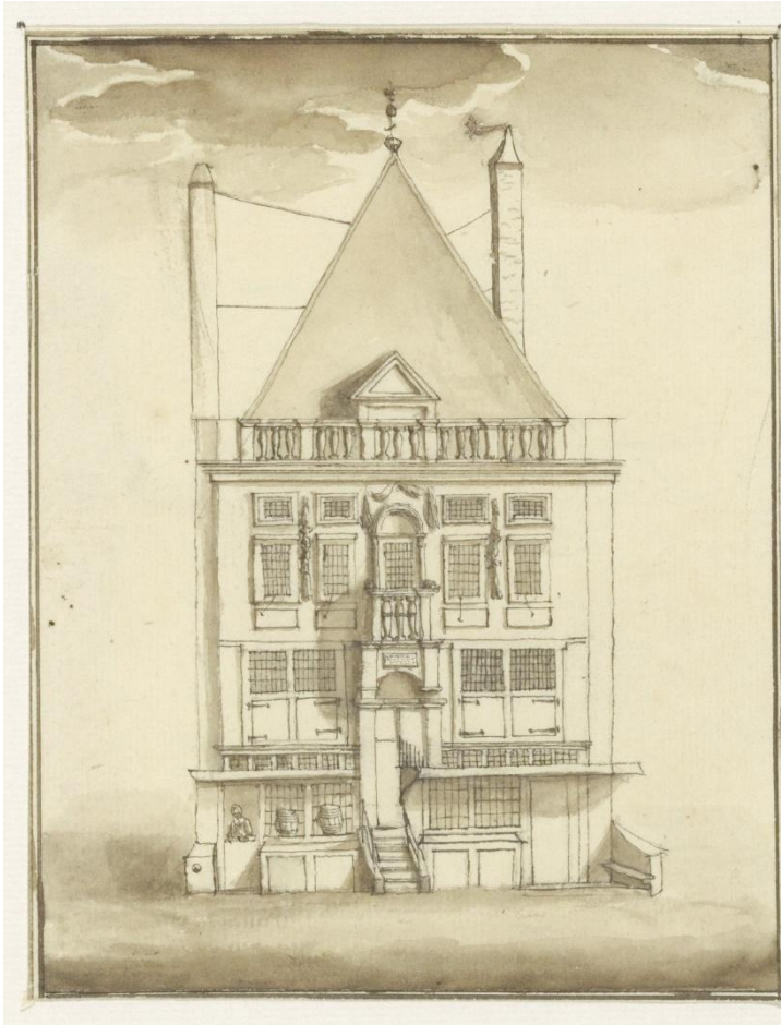
NL-HlmNHA_53001559_K ; A. Storck ???, 1700 ; Hoofdwacht