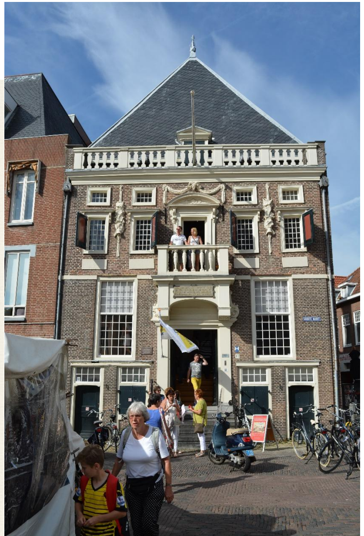
DSC_3742 ; AV ; 10-9-2016 ; Hoofdwacht tijdens Open Monumenten dagen