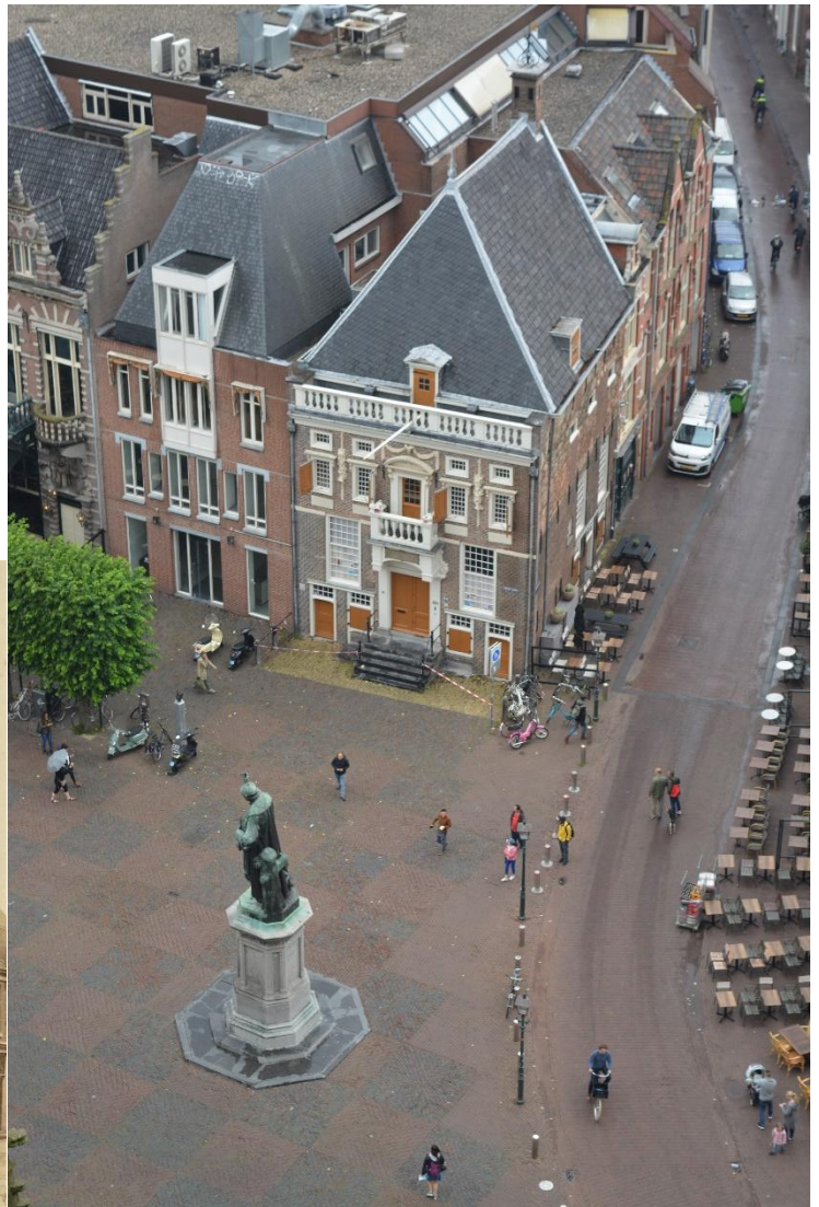
DSC_00020186 ; AV ; 24-6-2019 ; Hoofdwacht in vergelijkbare situatie als foto links, maar nu vanaf de tranen van de Grote Kerk