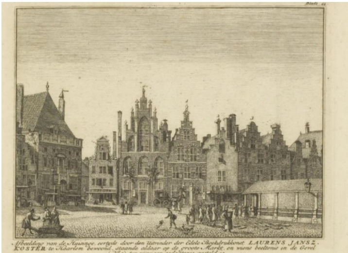
NL-HlmNHA_53001558_K ; H. Spilman; 1740; Uitsnede prent zelf met Hoofdwacht e.o.