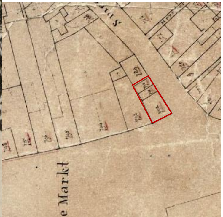
Uitsnede NL-HlmNHA_491_0588 ; A. van Diggelen ; 1823 ; Kadastrale kaart Haarlem(minuutplan), sectie C, blad 1, gen. Botermarkt