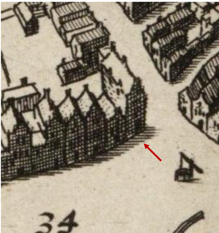
Uitsnede NL-HlmNHA_51000373_XL ; Thomas Thomasz. ; 1590 met situatie 1578. Kaart Haarlem na beleg 1573 en stadsbrand 1576

Een klein voorbeeld van de problemen rond het kiezen van een verantwoorde historische situatie.