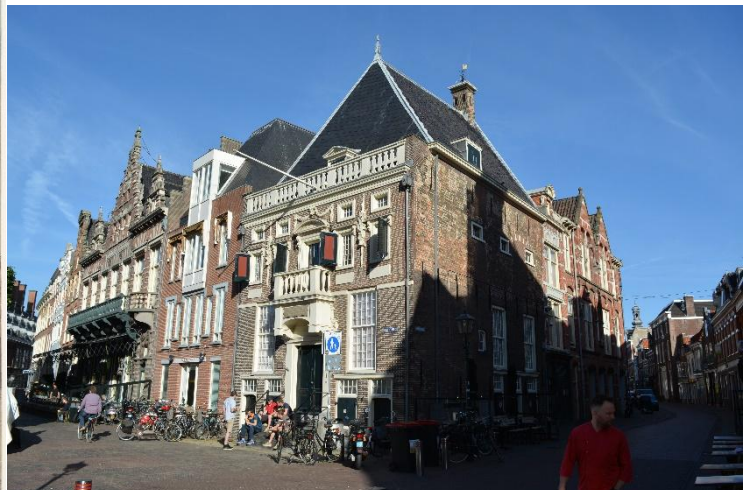
DSC_3623 ; AV ; 10-9-2016 ; Vergelijkbare situatie als prent links. Let op de verdwenen hijsbalk boven het dakraam aan de zijgevel langs de Smedestraat