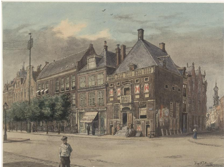
NL-HlmNHA_53001568_M ; H.M.J. Misset ; 1902 ; Hoofdwacht