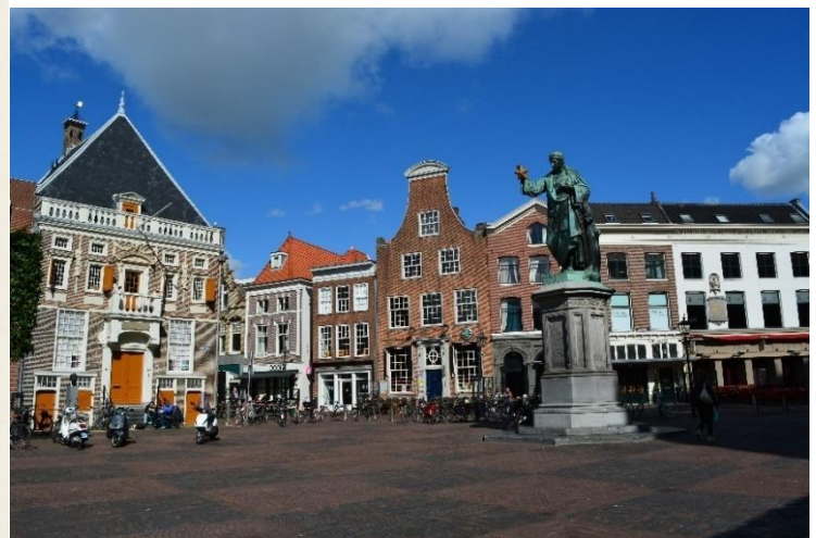
DSC_00016948 ; AV ; 24-9-2018 ; Vergelijkbare situatie als prent links, zij het iets meer naar rechts genomen, omdat anders de Hoofdwacht geheel achter de bomen zou verdwijnen