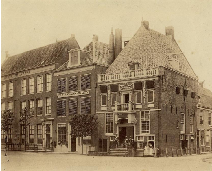
NL-HlmNHA_54000002 ; ? ; 1870 ; Hoofdwacht met huzaren. Toen nog functionerend als Hoofdwacht