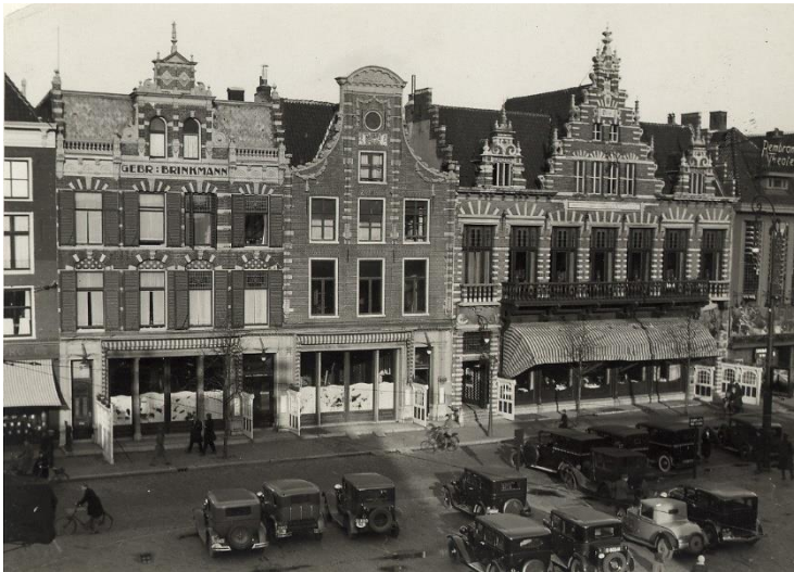
NL-HlmNHA_54019034 ; A. Peperkamp ; 1930 ; Brinkmann in volle glorie, met van l. naar r. : Grote Markt 9, Grote Markt 11 (Bilderdijkhuis en start van Brinkmann), Grote Markt 13 (De Kroon) en Grote Markt 15 (Rembrandttheater) (geheel links nog een klein stukje van Grote Markt 7, waar kledingconcern Kreymborg in een Brinkmannpand kwam)