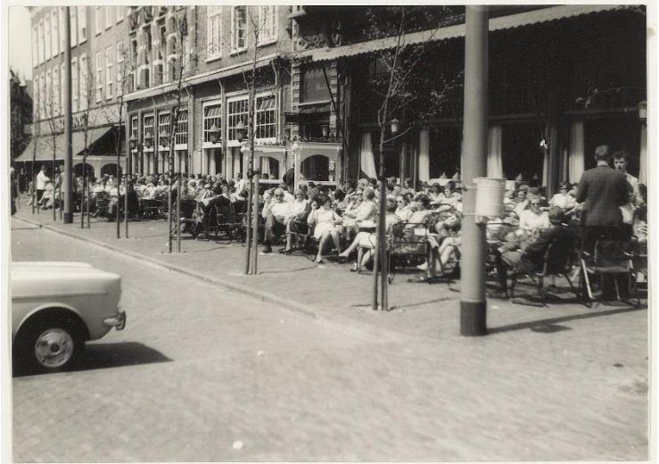
NL-HlmNHA_54030191 ; ? ; 1967 ; Het "beroemde" terras van Brinkmann

Brinkmann was een roemrucht horecacomplex, dat men lange tijd als de huiskamer van Haarlem beschouwde. Alhoewel het bedrijf zelf alweer bijna 50 jaar ter ziele is, leeft de naam nog steeds voort. Waar ligt de oorsprong en waar is die reputatie vandaan gekomen?