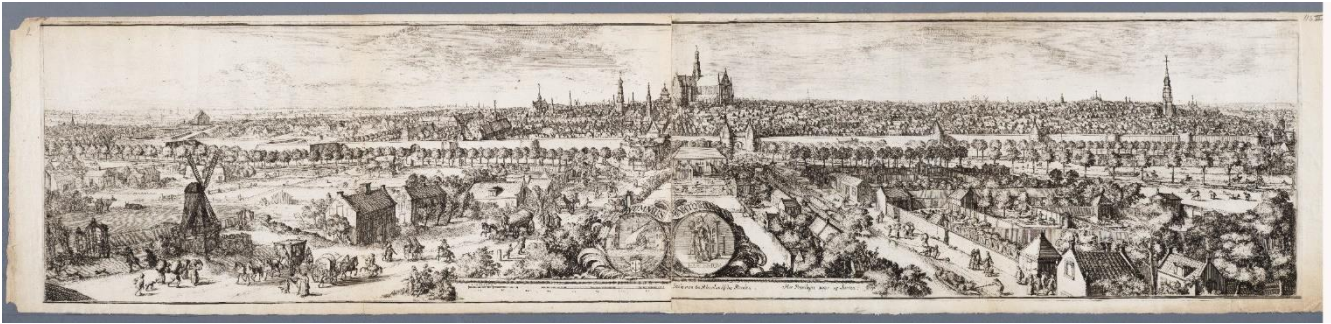
NL-HlmNHA_53008921 ; R. de Hooghe; 1688/1689; Gezicht op Haarlem vanuit het westen. HIERONDER : uitvergrotingen