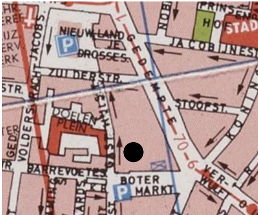
Locatie: Botermarkt 9

Link naar website van Haarlemse Hofjes: https://www.haarlemsehofjes.nl/