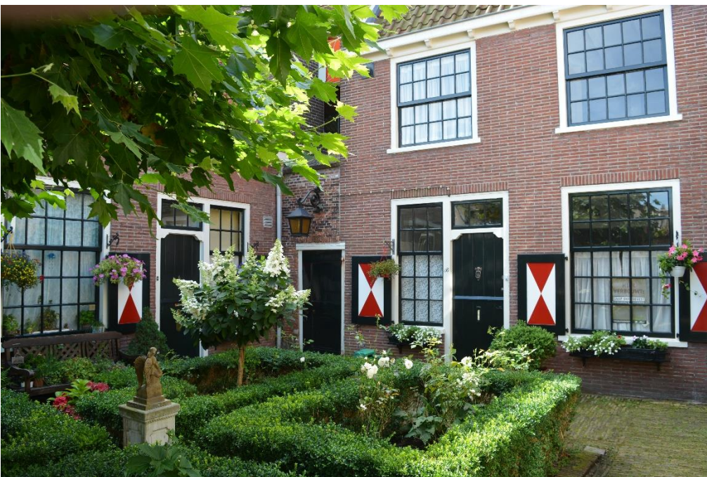
DSC_7779 ; AV ; 2-8-2017 ; binnenhof, gezicht richting zuidoost