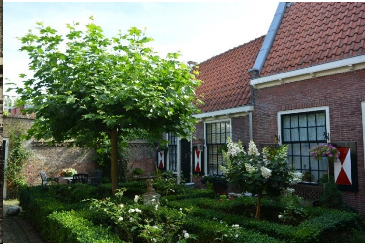
DSC_7780 ; AV ; 2-8-2017 ; Vergelijkbaar standpunt als foto links, maar iets meer naar het noorden gericht. De gevels zijn opvallend gewijzigd en de plek van de pomp ook.