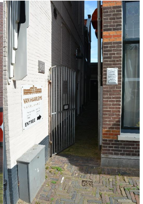
DSC_7776 ; AV ; 2-8-2017 ; toegang vanaf de Botermarkt. In het verleden kwamen zulk soort verborgen toegangen veel voor.

De exacte stichtingsdatum van het Bruiningshofje is niet helemaal duidelijk. Waarschijnlijk ligt het ergens in de jaren 1610-1618. Wel is duidelijk, dat het gesticht is door Jan Bruinincq Gerritsz. Dit hofje was sterk verbonden met de Doopsgezinde kerk van het Vlaamse Blok aan het Klein Heiligland.