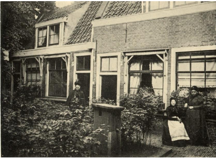
NL-HlmNHA_5401822 ; ? ; 1904 ; Bruiningshofje, binnenhof richting noordoost