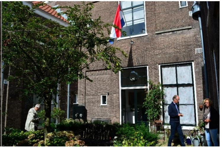
DSC_9271 ; AV ; 9-9-2017 ; Vergelijkbare situatie als op foto links