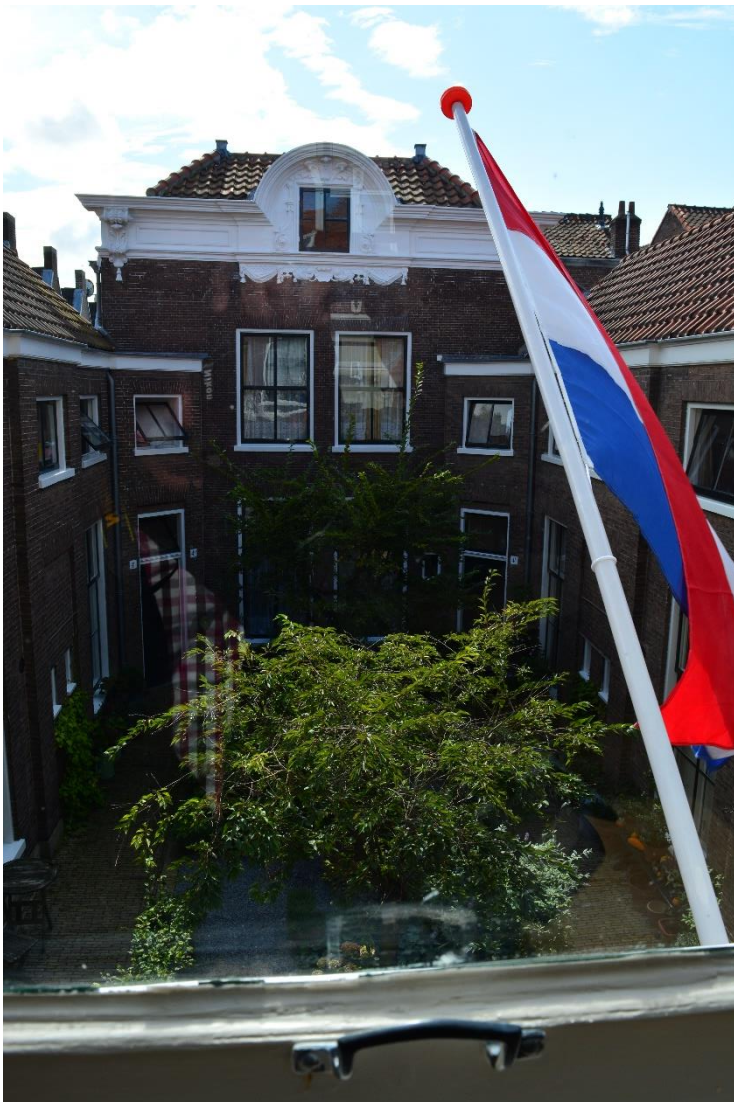
DSC_9270 ; AV ; 9-9-2017 ; Wijnbergshofje, binnenhof, gezicht richting zuid vanaf de eerste etage