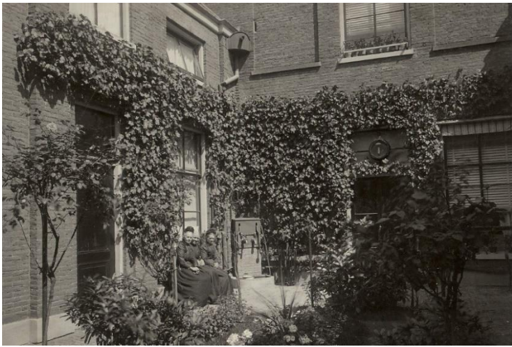
NL-HlmNHA_54018408 ; B. Zweers ; 1904 ; Wijnbergshofje, binnenhof richting noordwest