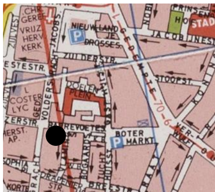
Locatie: Barrevoetestraat 4

Link naar website van Haarlemse Hofjes: https://www.haarlemsehofjes.nl/