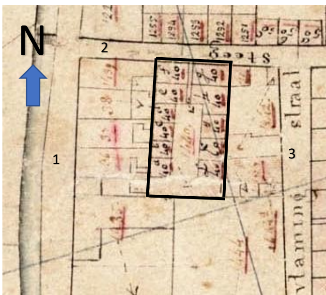
NL-HlmNHA_491_0588 ; A. van Diggelen ; 1823 ; Kadastrale kaart Haarlem(minuutplan), sectie C, blad 1, genaamd Botermarkt. Uitsnede Wijnbergshofje