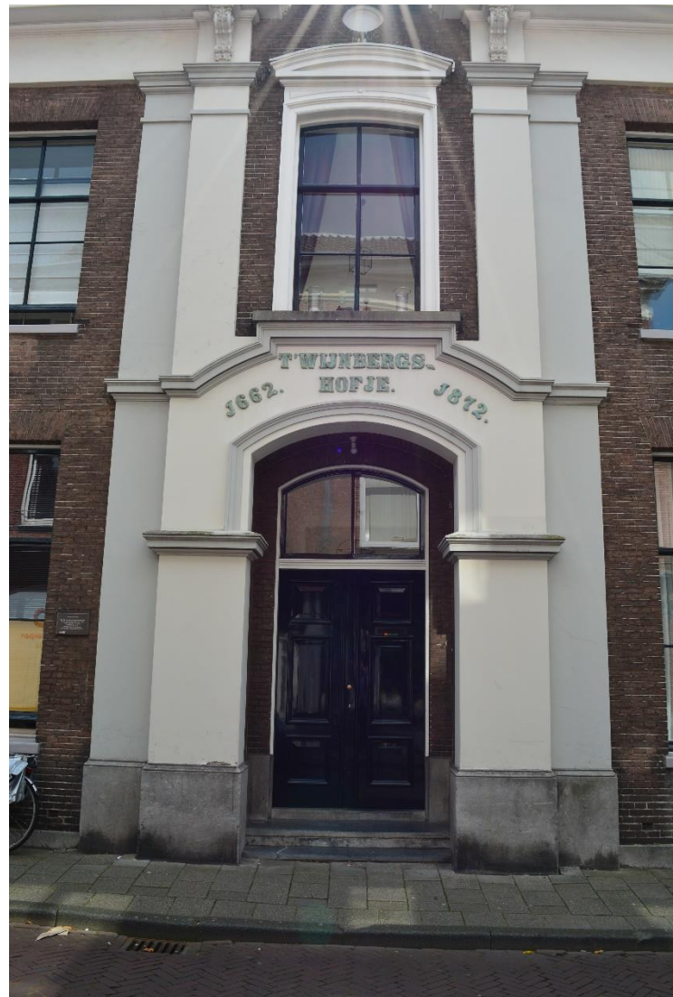
DSC_8336 ; 14-8-2017 ; Barrevoetstraat met voordeur van het Wijnbergshofje

Het Wijnbergshofje is niet gesticht uit de nalatenschap van een gefortuneerde weldoener. Het is gesticht door de Hoogduitse Doopsgezinde gemeente. Ook de stichtingsdatum is onbekend. Wel is bekend, dat het huis De Wijnberg, waar het oorspronkelijk in gehuisvest was, begin 17 e eeuw van de Hoogduitse Doopsgezinde gemeente was en lag aan wat nog de Barrevoetsteeg heette. Nu heet dit de Barrevoetstraat. Het functioneerde toen als vermaanhuis = predikhuis = kerk van de Hoogduitse Doopsgezinde gemeente. Deze gemeente fuseerde in 1651 of 1652 met de Vlaamse gemeente van de Blok aan het Klein Heiligland. Het huis schijnt na deze fusie als hofje ingericht te