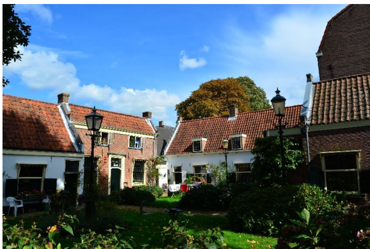
DSC_9287 ; AV ; 9-9-2017 ; binnenhof, gezicht richting noordoost