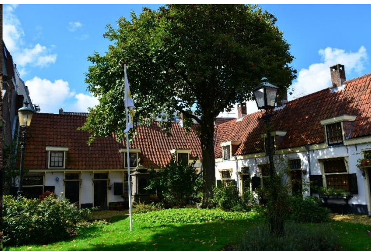
DSC_9297 ; AV ; 9-9-2017 ; binnenhof, gezicht richting west