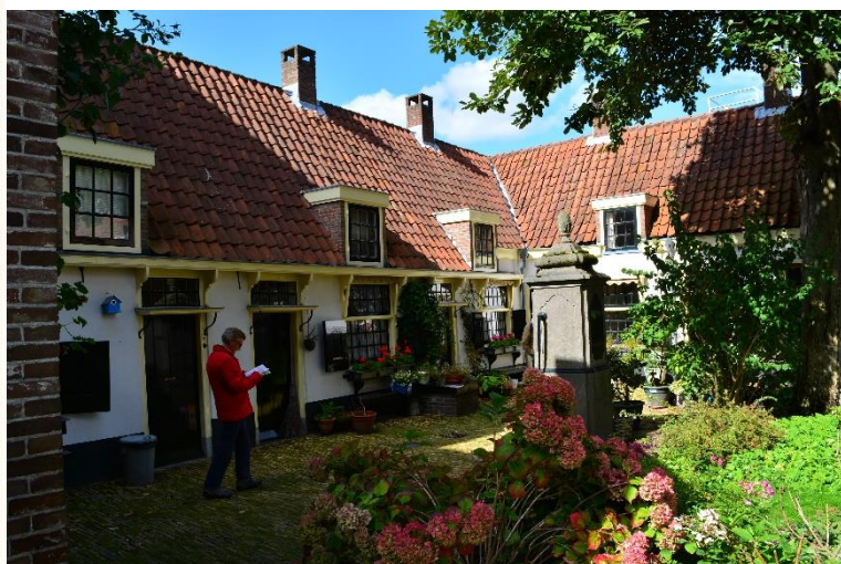
DSC_9288 ; AV ; 9-9-2017 ; AV ; Vergelijkbare positie als op foto links, maar wel iets meer naar het westen genomen