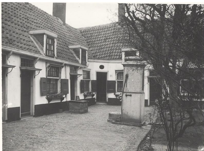
NL-HlmNHA_54006328 ; ? ; 1910 ; Binnenhof, gezicht richting noordnoordwest