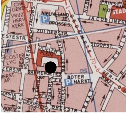
Locatie: Barrevoetestraat 7

Link naar website van Haarlemse Hofjes: https://www.haarlemsehofjes.nl/