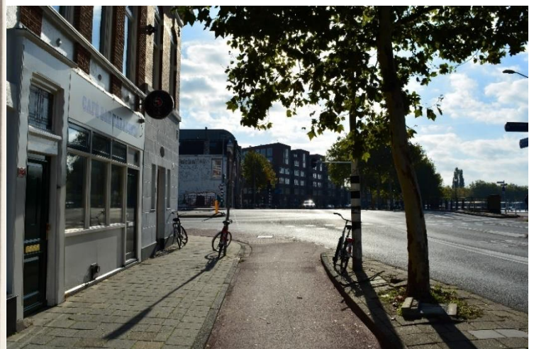
DSC_00017074 ; AV ; 30-9-2018 ; Vergelijkbare situatie als op afbeelding links. Wel is de foto iets meer naar links genomen, omdat je anders op een zeer drukke rijbaan staat