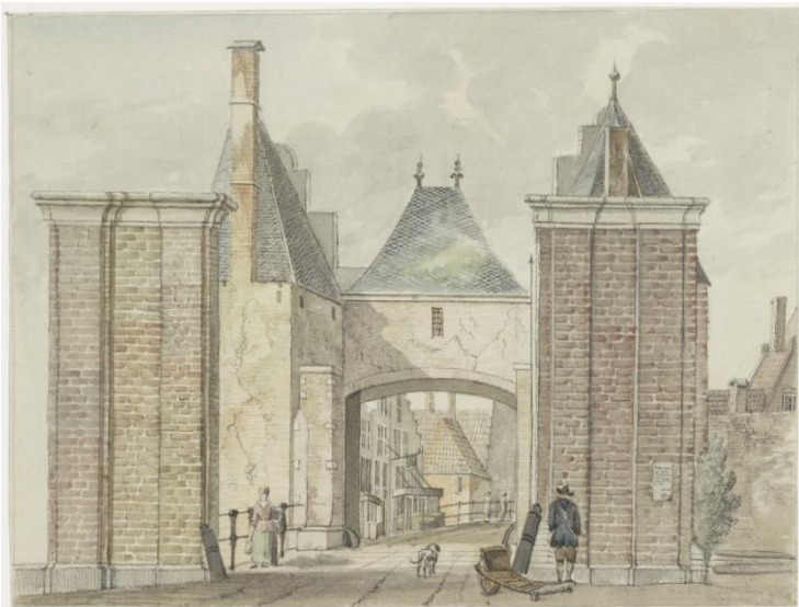
NL-HlmNHA_53000628_K ; H. Tavenier; 1781; Schalkwijkerpoort, doorkijk vanuit de landzijde de stad in