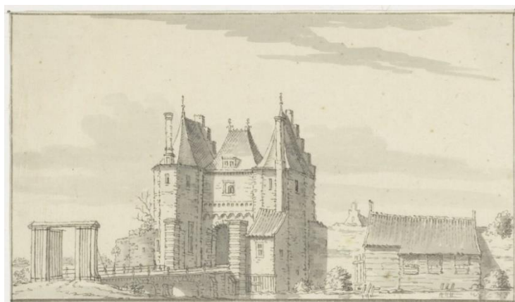
NL-HlmNHA_53000645_K ; J. Stellingwerff, 1720; Schalwijkerpoort richting west