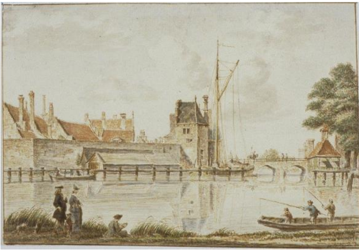
NL-HlmNHA_53000607_K; H. Spilman; 1780; Gezicht richting noordoost over het Spaarne op de zuidwestzijde van de Schalkwijkerpoort met aangrenzende stadsmuur