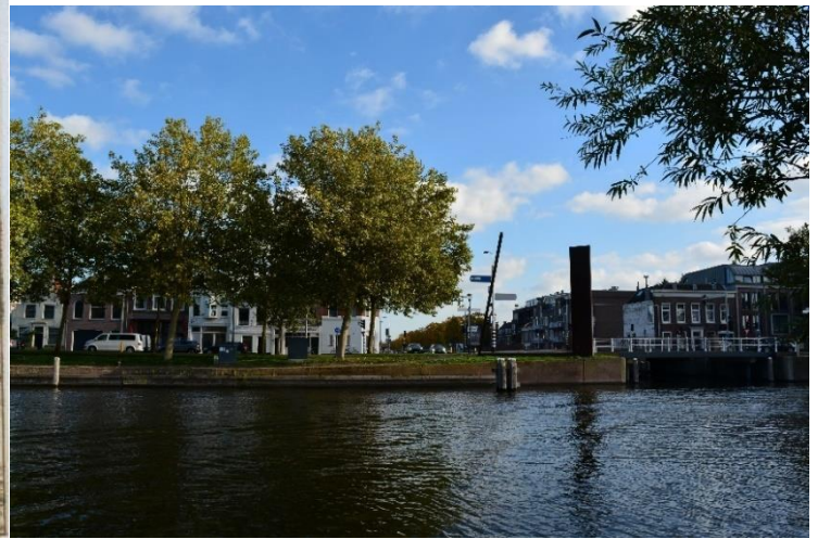
DSC_00017073 ; AV ; 30-9-2018 ; Vergelijkbare positie als prent links. Foto zou eigenlijk iets meer naar rechts genomen moeten worden, maar daar wordt het uitzicht volledig in beslag genomen door een woonboot. Foto biedt gezicht richting noordoost op de hoek Antoniestraat / Lange Herenvest en Schalkwijkerbrug