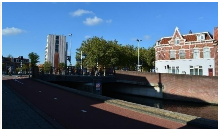
DSC_00017076 ; AV ; 30-9-2018 ; Vergelijkbare situatie als op afbeelding links. Foto vanaf Herensingel richting west op hoek Lange Herenvest / Antoniestraat. Aan overkant van Spaarne staat links voormalig kantoor Openbare Werken van gemeente Haarlem (Koningstein)