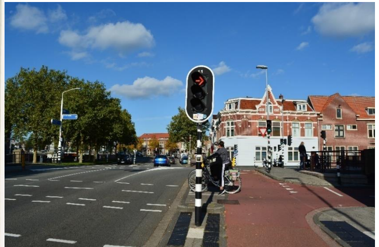
DSC_00017075 ; AV ; 30-9-2018 ; Vergelijkbare situatie als op afbeelding links. Wel is foto iets meer naar rechts genomen, omdat je anders op een zeer drukke rijbaan staat. De brug is de Schalkwijker-brug met inkiijk in Antoniestraat en rechts de Lange Herenvest