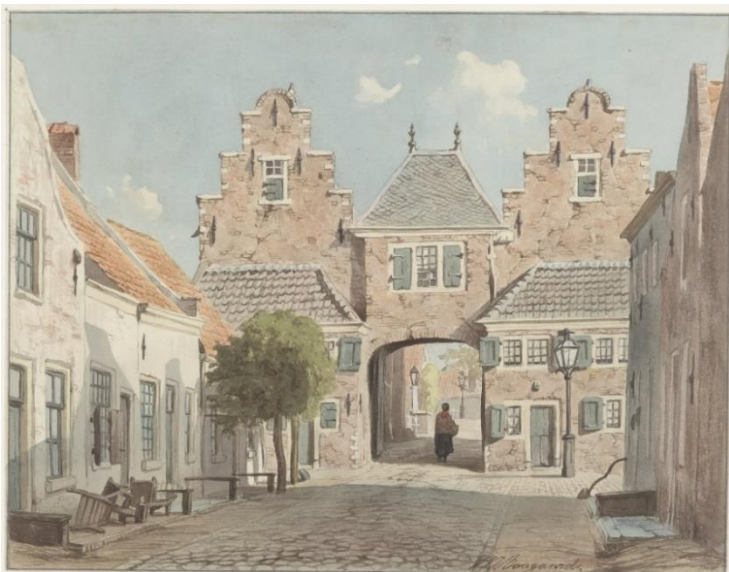
NL-HlmNHA_53000748_M ; W.J. Boogaard; 1866; Vanuit Antoniestraat zicht op stadszijde van Schalkwijkerpoort