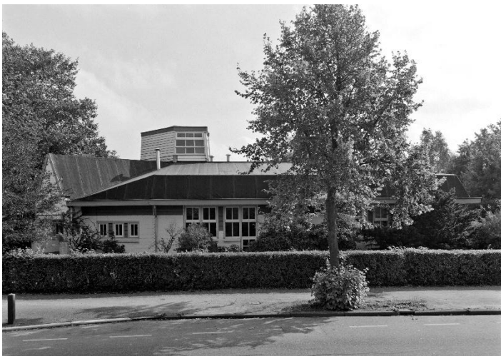
Haarlem, Noord-Hollandsarchief, Collectie 1336 glasnegatieven en foto's van het Bedrijf Openbare Werken te Haarlem betreffende topografisch Haarlem, Inventarisnummer 5589. Maker: J. Fielmich. Datum : 18 september 1991. Montessori school aan de Churchilllaan in Haarlem

Gestippelde lijn: omtrek van de wijk Zuiderhout 1 : locatie Churchilllaan 70 2 : locatie Louise de Colignylaan 3