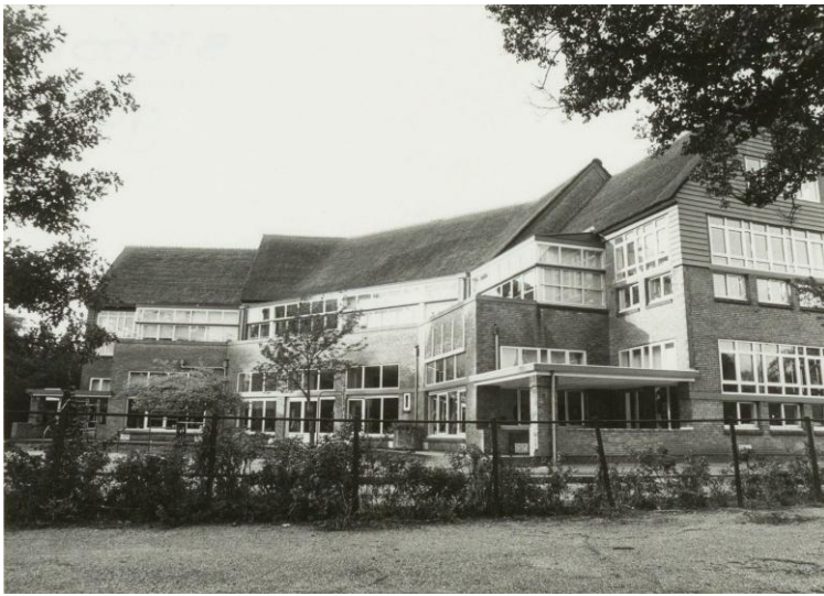
Haarlem, Noord-Hollandsarchief, collectie 1478 foto's en negatieven van Fotopersbureau De Boer te Haarlem, Inventarisnummer 4905. Datum: oktober 1989. De Haarlemse montessorischool aan de Louise de Colignylaan 3, ziende naar het noordwesten