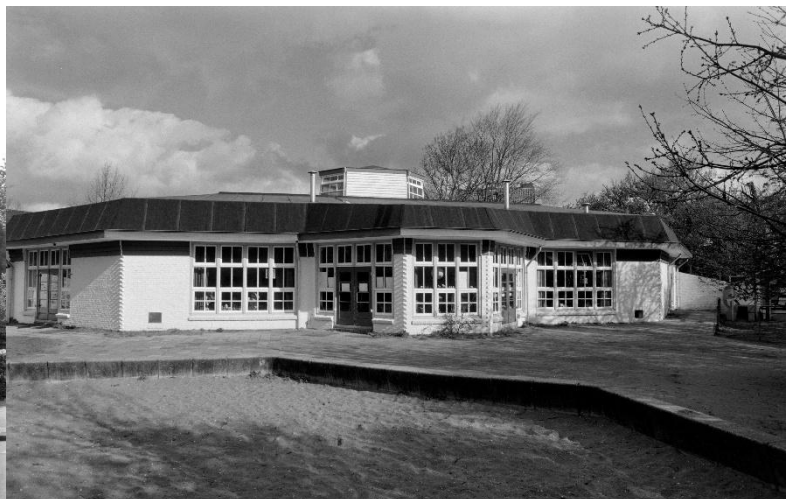
Haarlem, Noord-Hollandsarchief, collectie 1336 glasnegatieven en foto's van het Bedrijf Openbare Werken te Haarlem betreffende topografisch Haarlem. Inventarisnummer 5376. Maker: Fielmich. Datum: 18 september 1990. Montessorischool aan de Churchilllaan in Haarlem