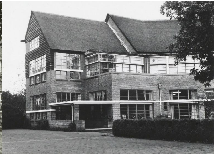
Haarlem, Noord-Hollandsarchief, collectie 1100 van gemeente Haarlem, Inventarisnummer 25242. Maker: ? Datum: 1971. Details van de Haarlemse montessorischool aan de Louise de Colignylaan 3