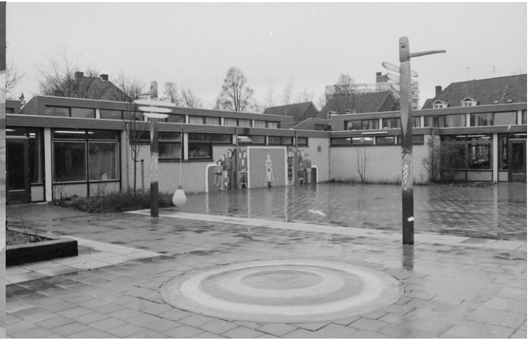
Haarlem, Noord-Hollandsarchief, Beeldbank De Boer, Inventarisnummer NL-HlmNHA_1478_20373K00_03. Datum: 10 februari 1981. Nieuw Speelobject voor de mytylschool Haarlem aan de Frederik Hendriklaan