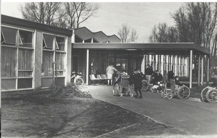
Haarlem Noord-Hollandsarchief, collectie 1100 van gemeente Haarlem, inventarisnummer 25224. Maker: ? Datum: 1968. Frederik Hendriklaan 73, mytyschool voor lichamelijk gebrekkige leerplichtige kinderen en kleuters