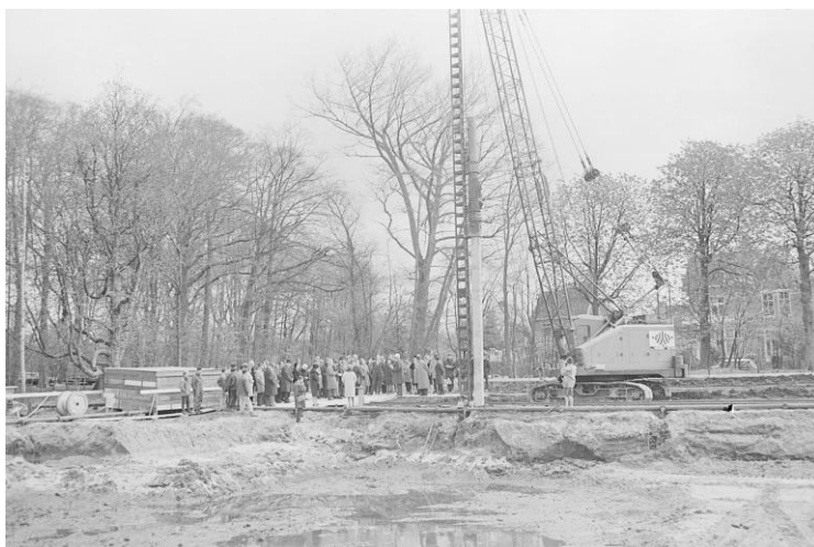
Haarlem, Noord-Hollandsarchief, Beeldbank De Boer, Inventarisnummer NL-HlmNHA_1478_05065K00_32. Datum: 18 april 1967. Het slaan van de eerste paal van Verpleeghuis Zuiderhout aan de Beelslaan/Zuiderhoutlaan

Gestippelde lijn: omtrek van de wijk Zuiderhout Zwarte stip: locatie van revalidatiecentrum Zuiderhout