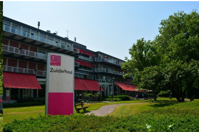
DSC_00015345 ; AV ; 29-5-2018 ; Verpleeghuis Zuiderhout, gezien richting zuidoost vanaf de Zuiderhoutlaan