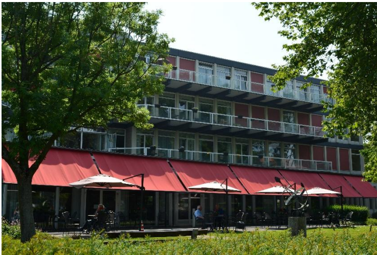
DSC_00015346 ; AV ; 29-5-2018 ; Verpleeghuis Zuiderhout, gezien richting zuidoost vanaf de Zuiderhoutlaan