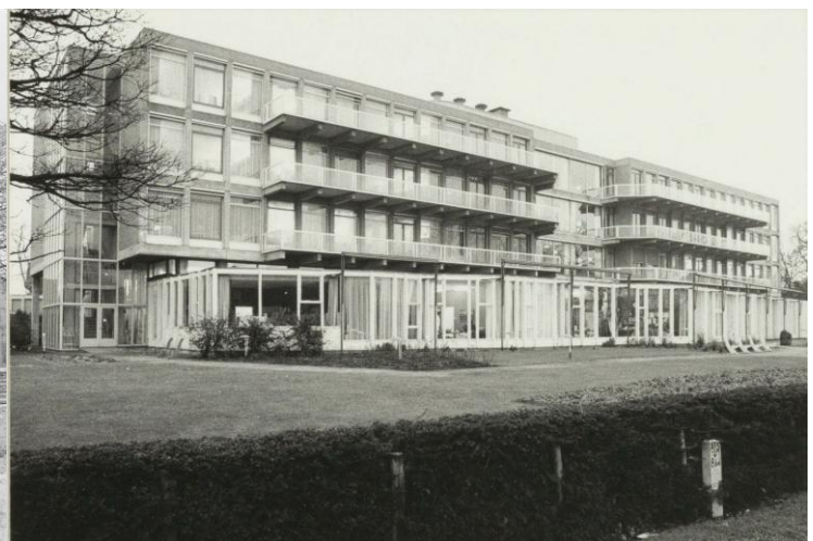
Inventarisnummer 4902. Datum: januari 1980. Verpleeghuis Zuiderhout, gezien richting zuidoost vanaf de Zuiderhoutlaan