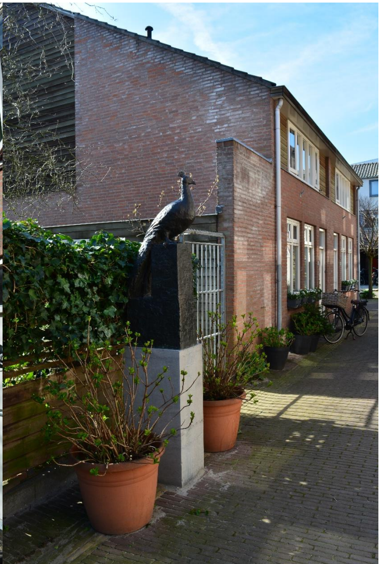
DSC_5934 ; AV ; 24-3-2017 ; dwarssteeg Frieseport, gezicht richting west op de zuidzijde