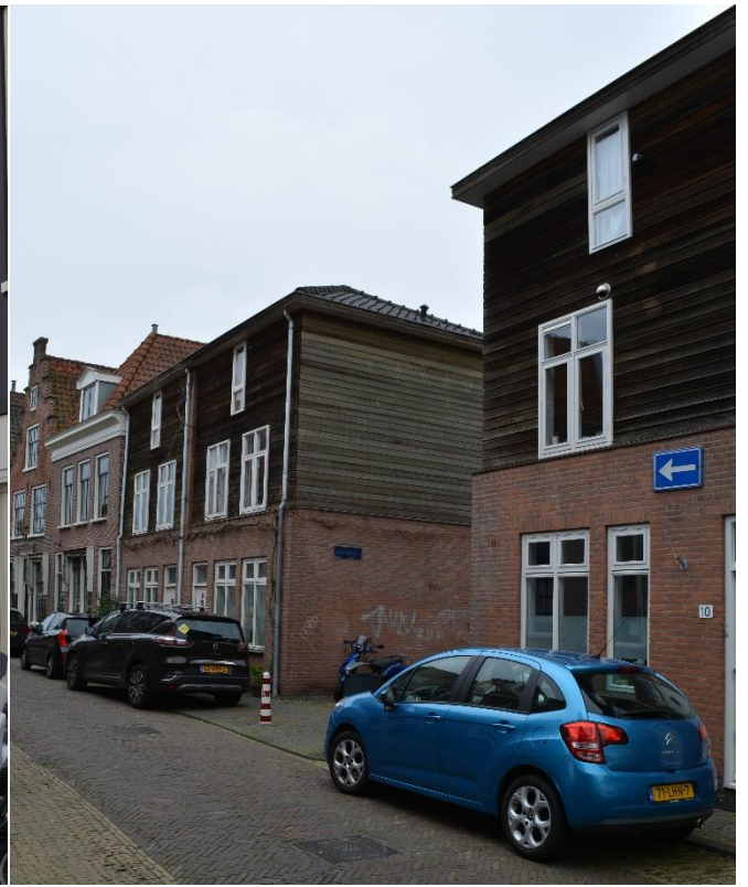
DSC_00022552 ; AV ; 18-3-2020 ; Groot Heiligland, gezicht richting zuidwest op de ingang van de dwarssteeg