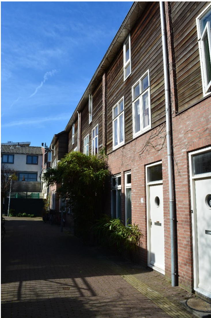
DSC_5935 ; AV ; 24-3-2017 ; dwarssteeg Frieseport, gezicht richting west op de noordzijde