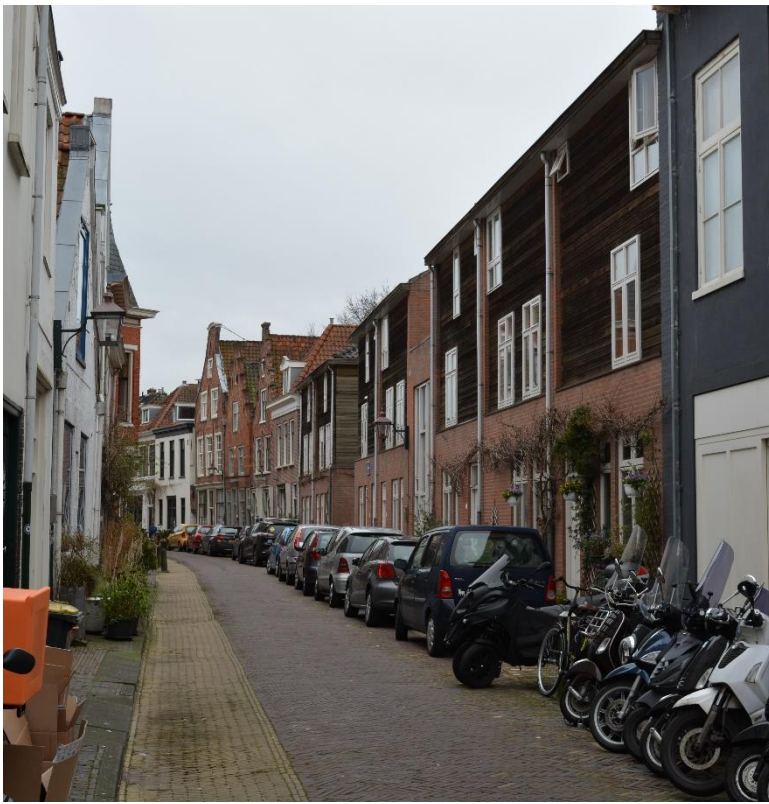
DSC_00022554 ; AV ; 18-3-2020 ; Groot Heiligland, gezicht richting zuid op de stadsvernieuwing Frieseport