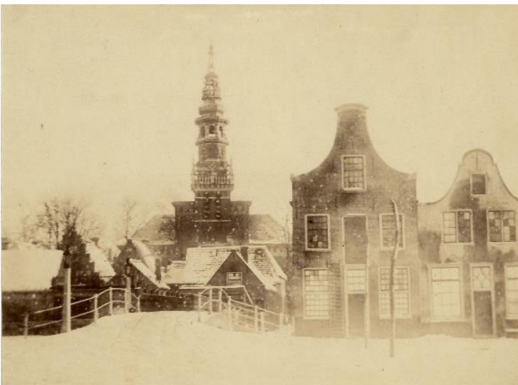
NL-HlmNHA_54002426 ; ? ; 1860; Zicht richting oost op Nieuwe Raam- straat en Nieuwe Kerk