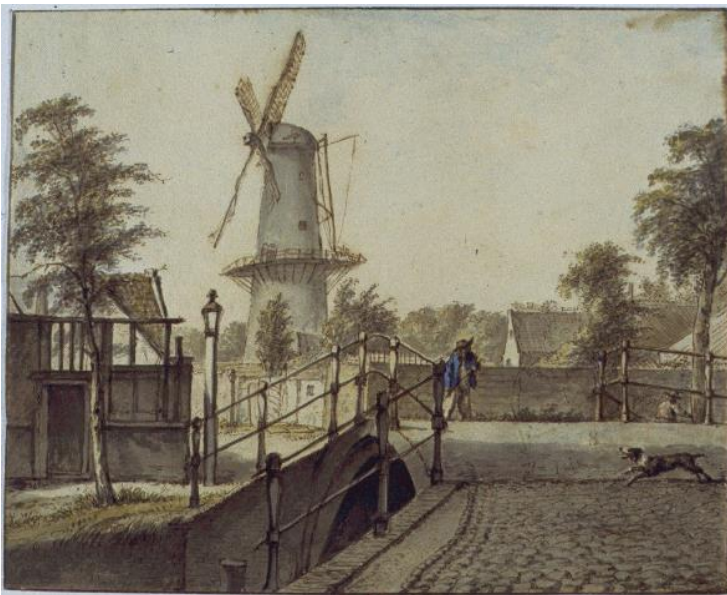
NLHlmNHA_53000174_K ; H. Wybrand; 1810; Gezicht richting west Vanaf hetzelfde standpunt als afbeelding hier boven