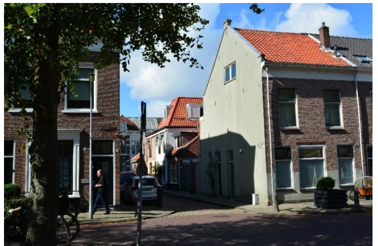
DSC_00016938 ; AV ; 24-9-2018 ;Vergelijkbare situatie als op afbeelding links