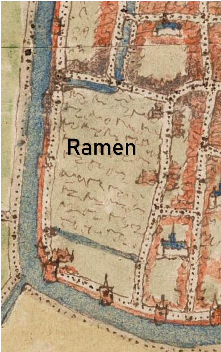
NL-HlmNHA_560_002423 ; J. van Deventer ; ca. 1560; Kaart van Haarlem, Uitsnede Ramen