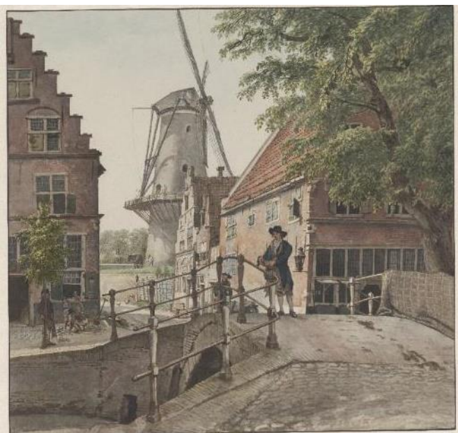
NLHlmNHA_53000172_G ; H. Wybrand; 1802; Gezicht richting west. Nu Gedempte Raamgracht met gezicht richting west in Korte Wolstraat