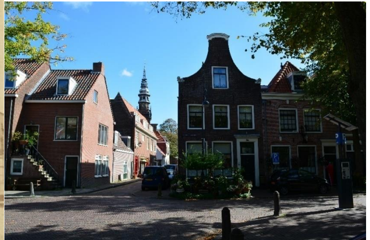
DSC_00016935 ; AV ; 24-9-2018 ; Vergelijkbare situatie als foto links. Door andere lens komen de verhoudingen anders over