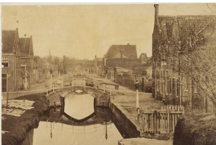
NL-HlmNHA_54000380_01 ; ? ; 1860; Zicht richting noord over de Raamgracht even ten zuiden van de Nieuwe Raamstraat