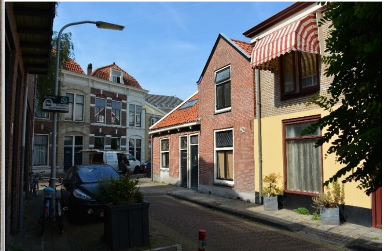
DSC_8851 ; AV ; 28-8-2017 ; Close up van het directe gebied rond molen De Hoop op de afbeelding links. Gezicht richting noordwest vanaf het westelijke uiteinde van de Korte Wolstraat