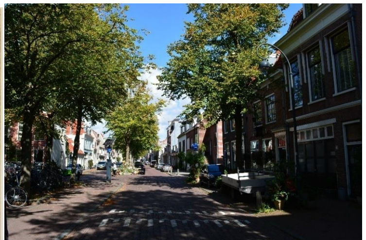
DSC_00016937 ; AV ; 24-9-2018 ; Vergelijkbare situatie als foto links. De foto links is op een veel hoger standpunt genomen, mogelijk vanaf de stadsmuur?

De naam Gedempte Raamgracht dateert uit 1861. Al in 1471 komt een Raamgracht (Ramengraft) voor, maar dat moet het grachtje zijn, dat de Oude Doelen van de Ramen afscheidde. Dat heet nu Gedempte Voldersgracht. Pas in de 17 e eeuw is dit grachtje tot de Raamsingel doorgetrokken met