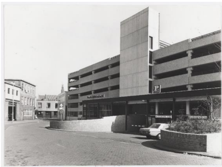
NL-HlmNHA_54033183 ; ? ; 1974 ; De Witstraat, gezicht richting noord op ingang van Parkeergarage De Kamp. Vergelijkbare situatie als foto hierboven