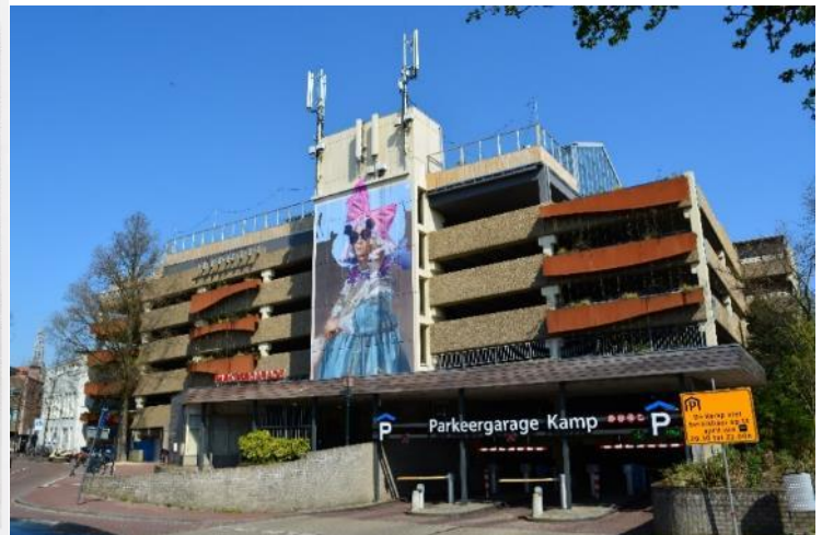
DSC_00018938 ; AV ; 8-4-2019 ; Vergelijkbare situatie als foto links en linksboven

Wat valt er nu over een parkeergarage te vertellen? Zo'n ding is een keer ontworpen en gebouwd en het is functioneel. Dan zijn we toch klaar? Bij parkeergarage De Kamp zit het toch iets anders volgens mij. Voor de bouw van de garage stonden ter plekke de bedrijfshallen van de drukkerij Boom-Ruygrok. Volgens bovenstaande foto's is door de sloop daarvan aan stedenschoon weinig verloren gegaan. Toch betekende de bouw van de garage geen verbetering. Als bijzonderheid kan toch wel vermeld worden, dat deze garage zo ongeveer het lelijkste gebouw in de stad is. Het lijkt wel een buitenaards geheel, dat per ongeluk in deze wijk gestrand is.