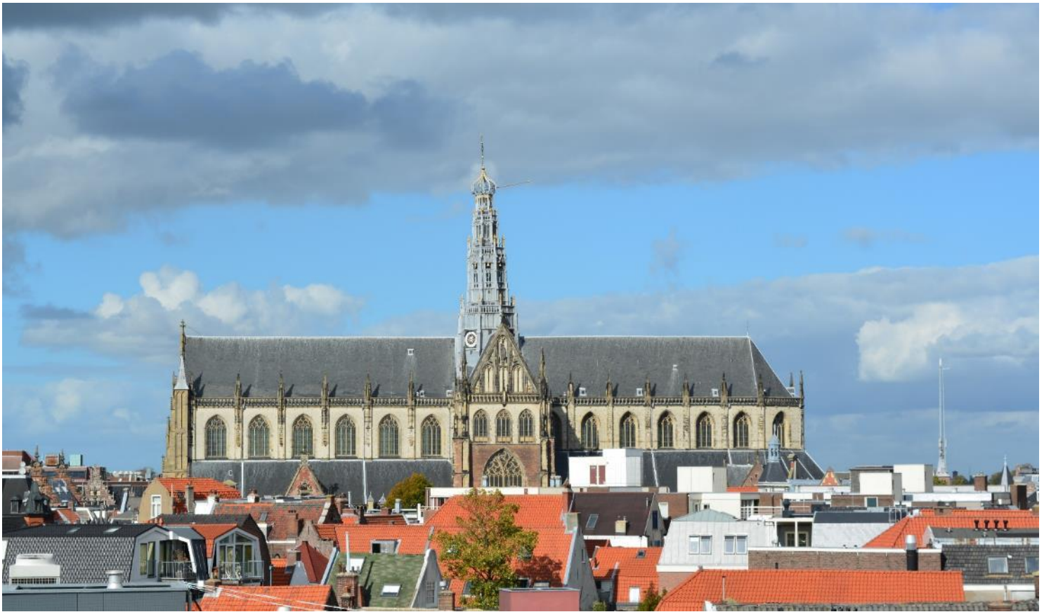
DSC_00017009 ; AV ; 28-9-2018 ; Gezicht richting noord op de Grote Kerk vanaf het terras van De Dakkas