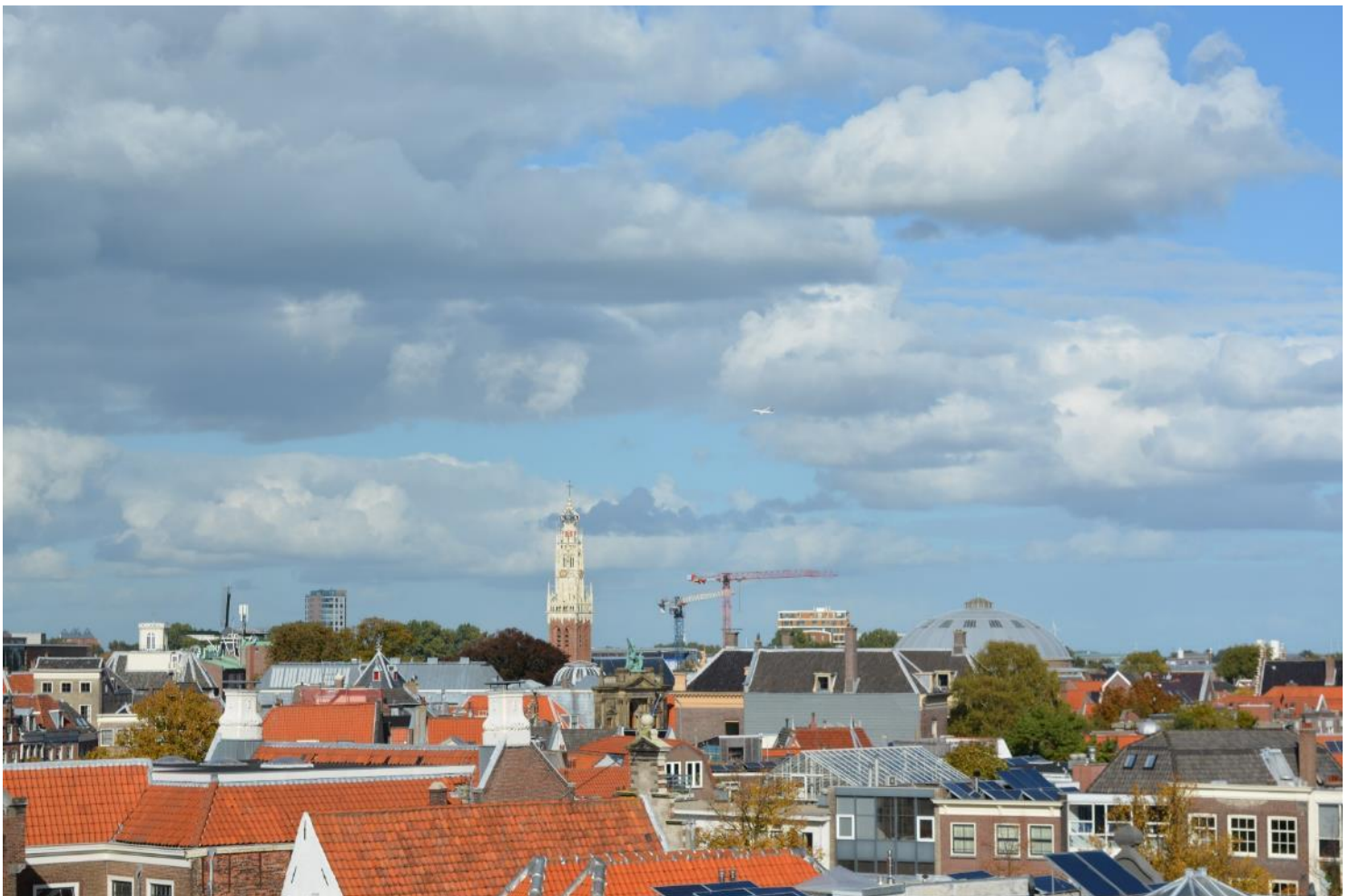
DSC_00017053 ; AV ; 28-9-2018 ; Gezicht richting noordoost op molen Adriaan, Bakenessertoren en voormalige gevangenis De Koepel vanaf het terras van De Dakkas