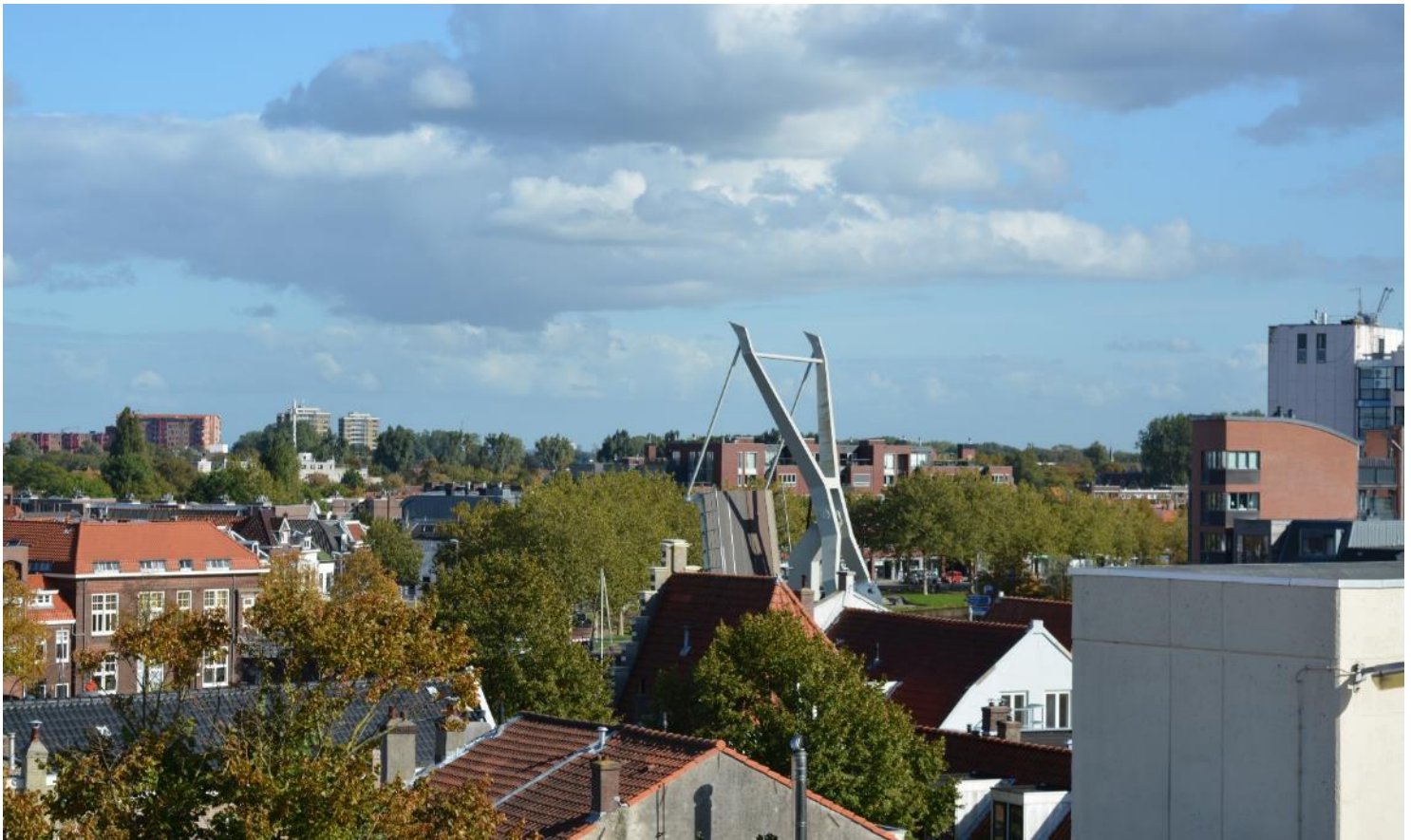
DSC_00017046 ; AV ; 28-9-2018 ; Gezicht richting zuidoost op de Verfroller(net open voor een schip) vanaf het terras van de Dakkas