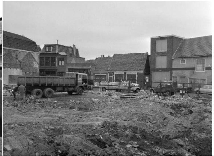
NL-HlmNHA_JosF19731217_016 ; 17-12-1973 ; De Witstraat, gezicht richting west op de westzijde van de Witstraat tijdens de sloop van de achterkant van drukkerij Boom-Ruygrok t.p.v. waar nu Parkeergarage De Kamp staat