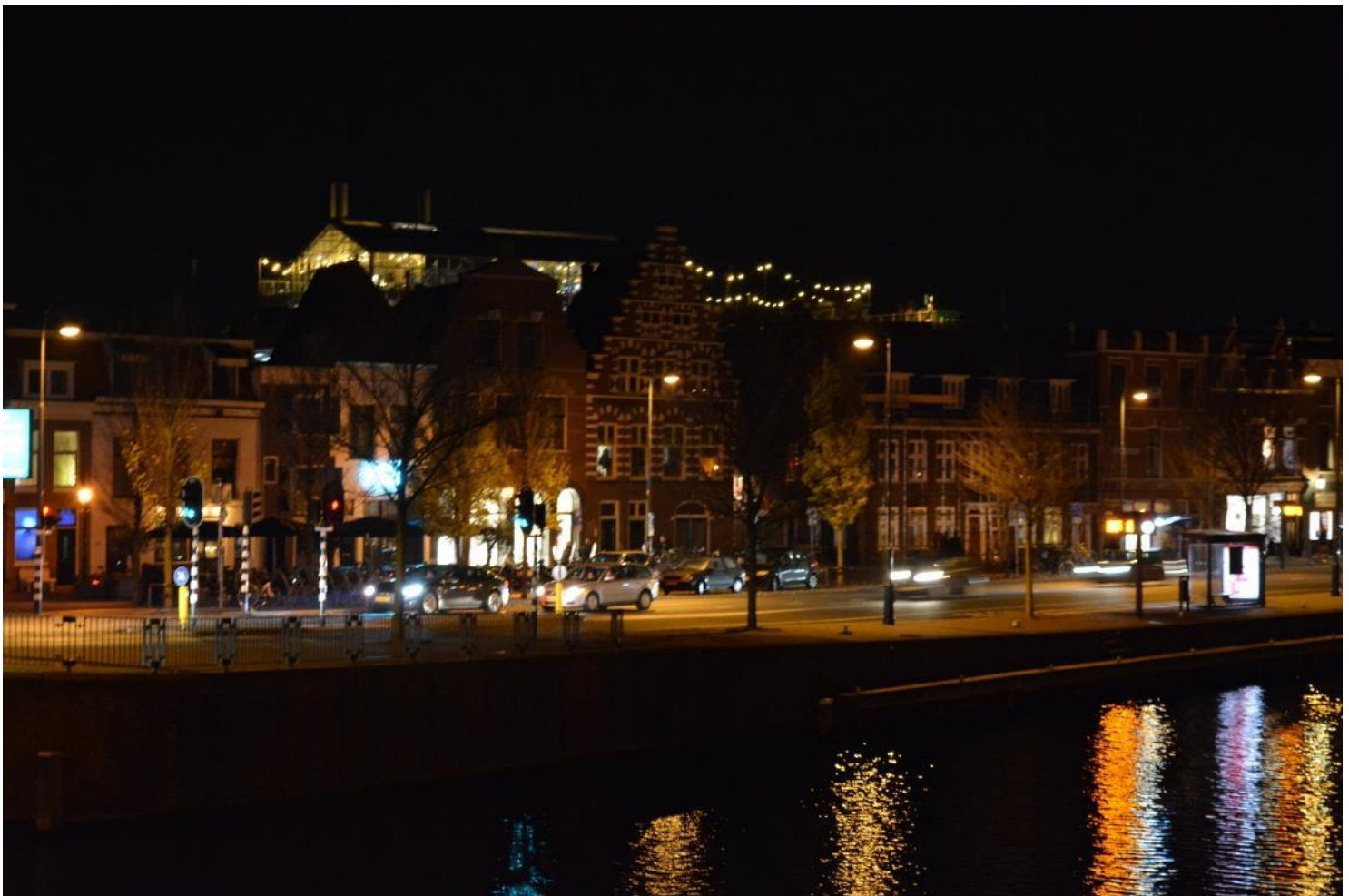
DSC_00021854 ; AV ; 22-11-2019 ; Gezicht richting west vanaf de Verfroller over het Spaarne met zicht op de Turfmarkt en daar boven restaurant de Dakkas