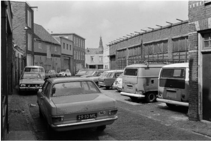
NL-HlmNHA_JosF19720307_046 ; 7-3-1972 ; De Witstraat, gezicht richting noord. Rechts de achterkant van voormalige drukkerij Boom-Ruygrok. Onderstaande 2 foto's zijn min of meer van dezelfde plaats als deze foto genomen.