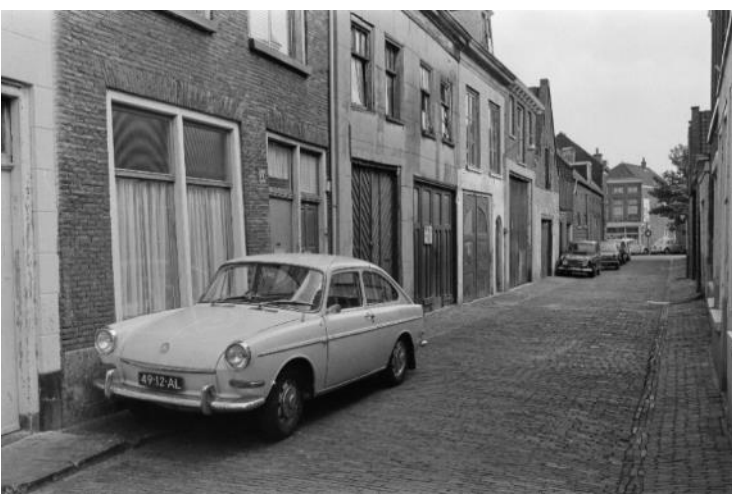
NL-HlmNHA_JosF19720307_043 ; J. Fielmich ; 7-3-1972 ; De Witstraat, gezicht richting zuid