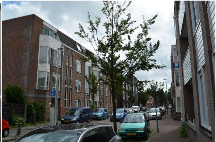
DSC_7555 ; AV ; 29-7-2017 ; Vergelijkbare situatie als foto links