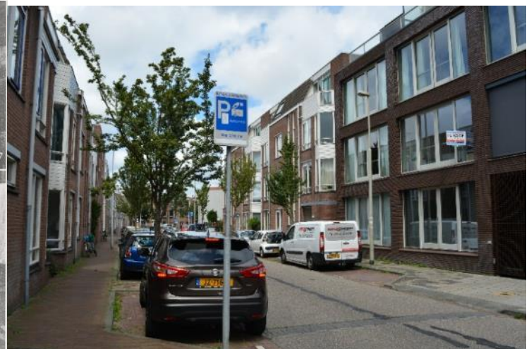
DSC_7556 ; AV ; 29-7-2017 ; vergelijkbare situatie als foto links