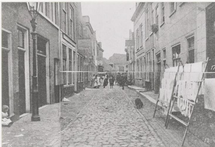
NL-HlmNHA_54020418 ; ? ; 1912 ; De Witstraat, gezicht richting noord

Door de stadsvernieuwing van de laatste decennia is de De Witstraat onherkenbaar veranderd. Zie onderstaande vier foto's.