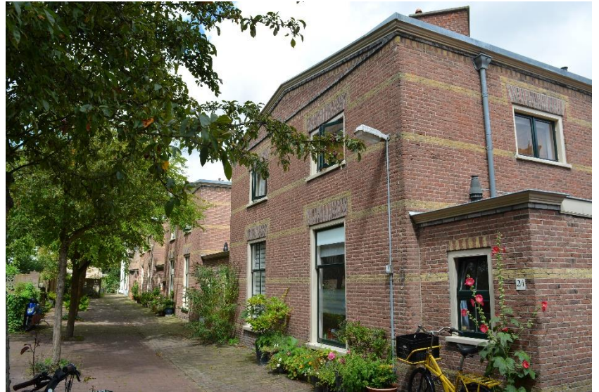
DSC_7583 ; AV ; 29-7-2017 ; Rozemarijnsteeg, gezicht richting noordoost. Rechts het Essenhofje. Standpunt iets meer naar links dan op foto links

Het Essenhofje is gebouwd om arbeidersgezinnen een nette woning te geven in een tijd, dat de gemiddelde arbeider op een beroerde manier woonde. Dat was rond 1866. Het klassieke hofje is bedoeld als huisvesting voor behoeftige alleenstaande oude dames om die een verzorgde oude dag te geven. Daarom vinden de echte puristen, dat je het Essenhofje geen hofje mag noemen en komt het in de boekjes over Haarlemse hofjes helemaal niet voor, afgezien van een enkel boekje, waar er zijdelings een enkel woord over gezegd wordt. Als je echter kijkt naar de oorsprong, dan kan je het Essenhofje naar mijn mening niet naar de letter, maar wel naar de geest toch een hofje noemen. Het klassieke hofje werd meestal t.b.v. arme Haarlemmers gesticht uit de nalatenschap van een rijke Haarlemse inwoner. Dit is ook het geval bij het Essenhofje en aangezien er tegenwoordig geen gezinnen meer wonen maar hoofdzakelijk ouderen, net zoals in het klassieke hofje, is het verschil onderhand marginaal te noemen. Er valt dus veel voor te zeggen om het Essenhofje toch maar een hofje te noemen, ook al wijkt de bouwvorm iets af. En oh ja: in het Essenhofje mag je huisdieren houden, terwijl dat in de meeste klassieke hofjes niet mag. Verdere verschillen : naast vrouwen wonen er ook MANNEN in het hofje, heeft men het niet over de Regenten, maar over de Beheerscommissie en zijn er ook aan de buitenkant woningen.