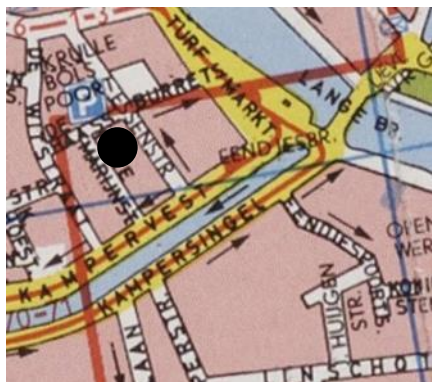
Locatie: Rozemarijnsteeg/Essenstraat 24

Link naar website van Haarlemse Hofjes: https://www.haarlemsehofjes.nl/