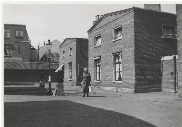
NL-HlmNHA_54008236 ; A.M. Voetelink ; 1942 ; Essenstraat 24 F-L, nu