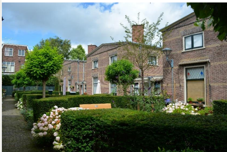
DSC_7585 ; AV ; 29-7-2017 ; Essenhofje, binnenhof, gezicht richting noordoost. Iets meer uitgezoomd t.o.v. foto links