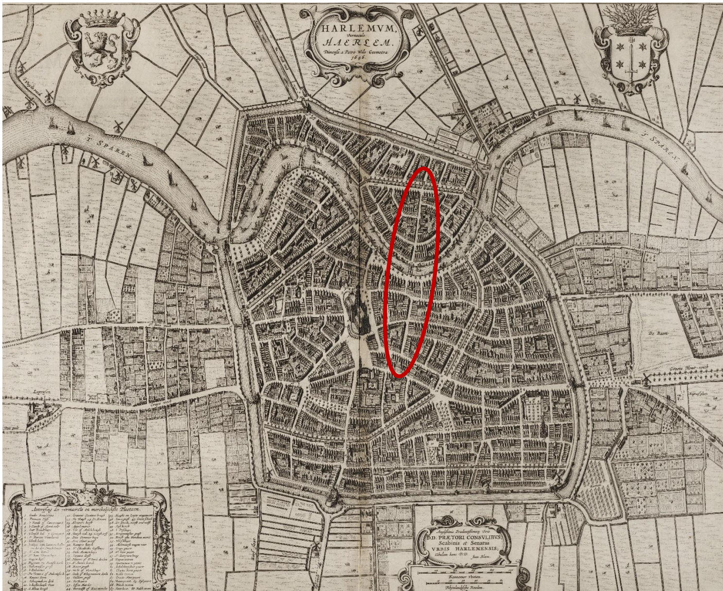
NL-HlmNHA_560_000796_G ; P. Wils, 1646; Haarlem. Binnen de rode ovaal de wat vreemde verbinding

De zwarte streep geeft de oost/west-verbinding Anegang-Korte Veerstraat-Melkbrug-Hoogstraat-Hagestraat weer.