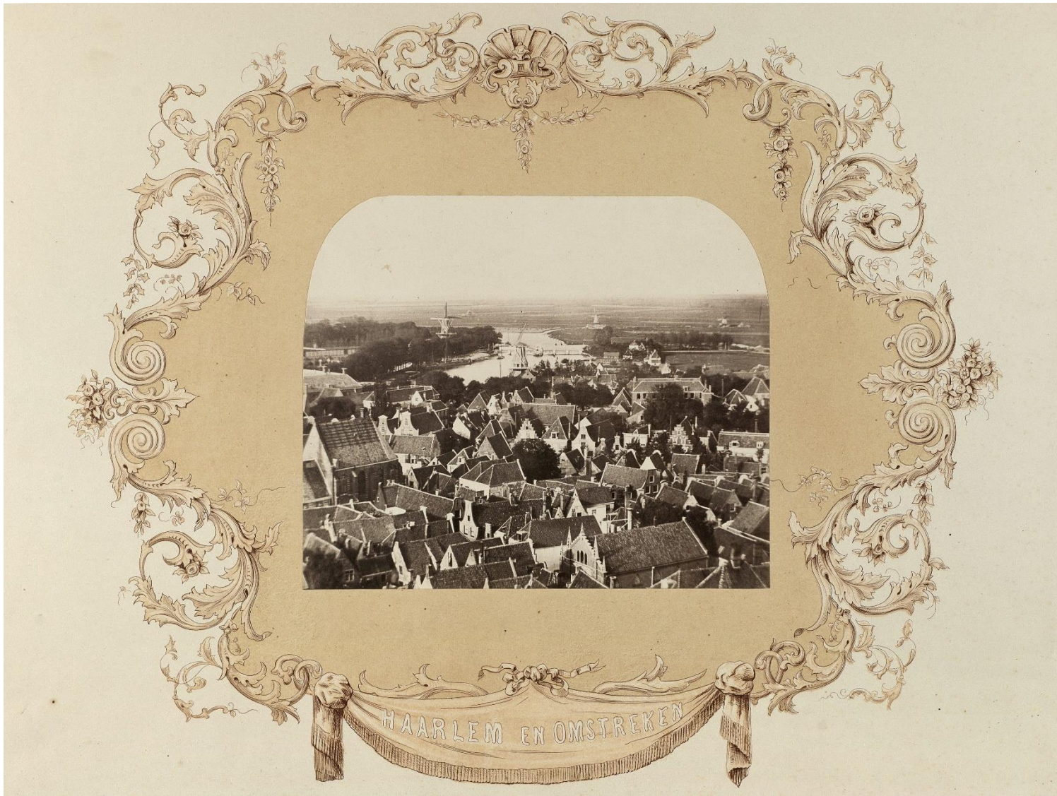
NL-ImNHA_54025666_M; Munnich & Ermerins; 1858; Uitzicht vanaf toren Grote Kerk over Begijnhof e.o.

Er zijn vijf kenmerken, die het karakter van een begijnhof kenmerken: