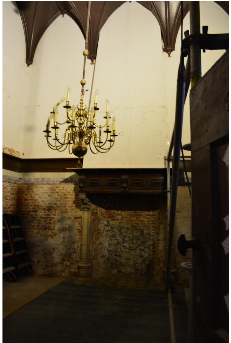
DSC_00016771 ; AV ; 9-9-2018 ; consistoriekamer tijdens de restauratie