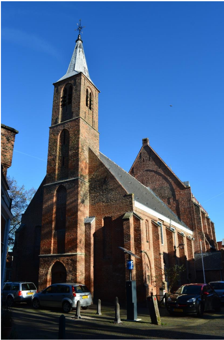
DSC_00023483 ; AV ; 18-11-2020 ; gezicht richting oost op de Waalse Kerk vanuit de Begijnesteeg