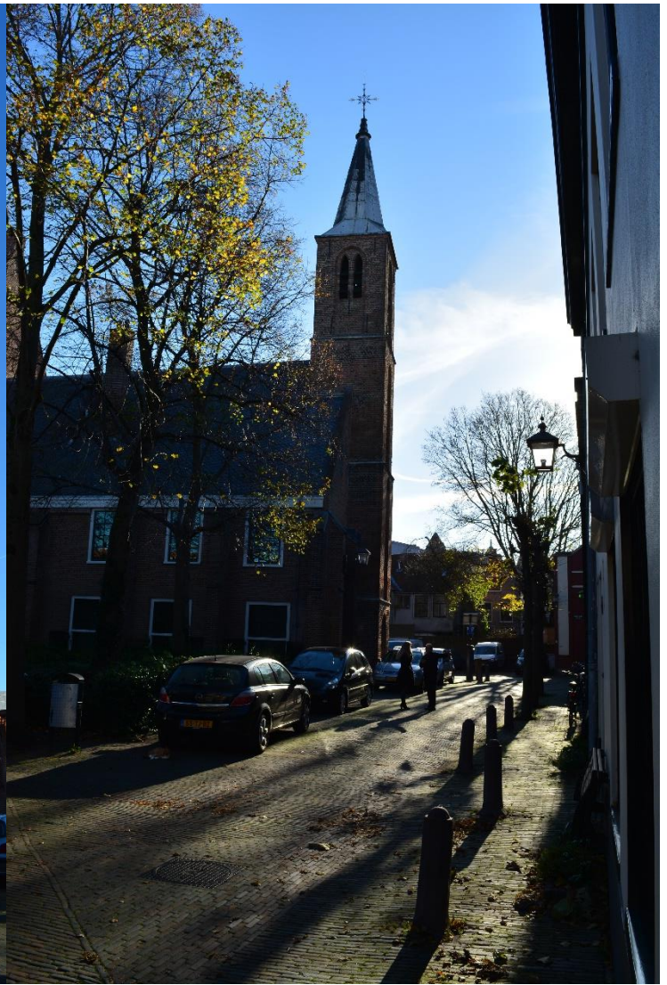
DSC_00023487 ; AV ; 18-11-2020 ; gezicht richting zuid op de Waalse Kerk

De Waalse Kerk, ook wel geheten Begijnenkerk, is het oudste kerkgebouw in Haarlem. De precieze bouwdatum is niet bekend. Het Begijnhof, waar de kerk het middelpunt van is, is rond 1262 gesticht. De kerk zal toch niet veel later gebouwd zijn. Hij moet er toch al in 1272 gestaan hebben, want er is bekend, dat toen in die kerk de eerste pastoor begraven is. Bij een grote stadsbrand in 1347 is de kerk zwaar beschadigd geraakt, maar kort daarop al hersteld. In 1388 verrees het huidige hoogkoor. 10 jaar later kreeg de kerk een toren en werd hij aan de westkant vergroot. Nog weer later, in 1420, werd er in de kerk een tribune voor de begijnen gebouwd en een sacristie. Deze sacristie is de huidige consistoriekamer met zijn zeer bijzondere laatgotische hangende gewelf en bijzondere betegeling.