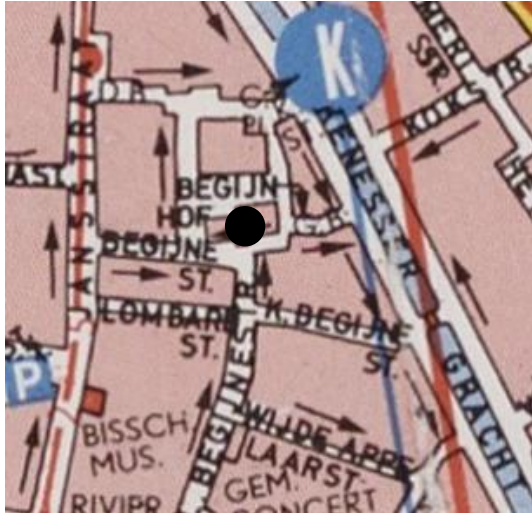
Locatie: midden in Begijnhof