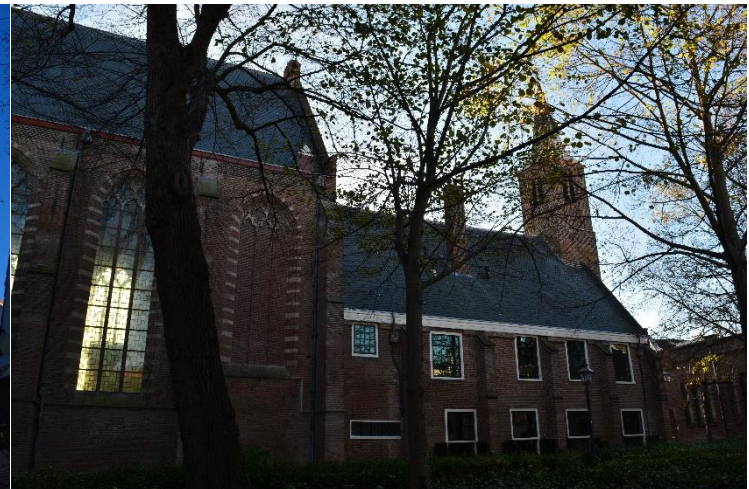
DSC_0002349 ; AV ; 18-11-2020 ; gezicht richting zuidwest op de Waalse Kerk