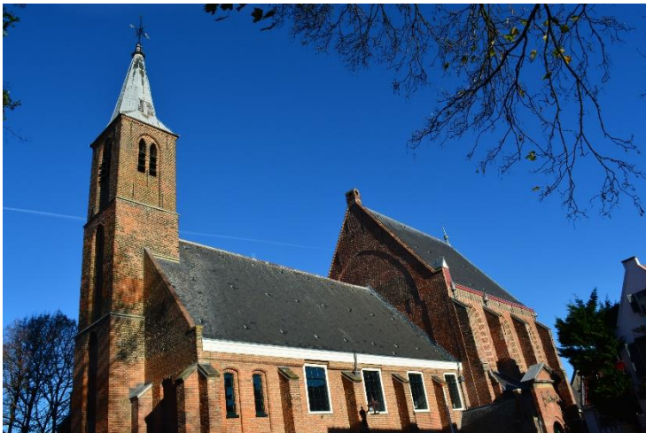
DSC_00023481 ; AV ; 18-11-2020 ; gezicht richting noordoost op de Waalse Kerk