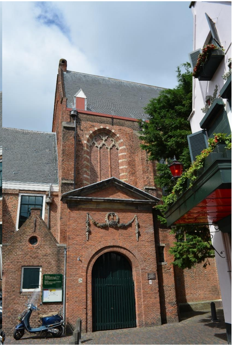
DSC_6706 ; AV ; 2-7-2017 ; Gezicht richting noord op het zuidportaal van de Waalse kerk