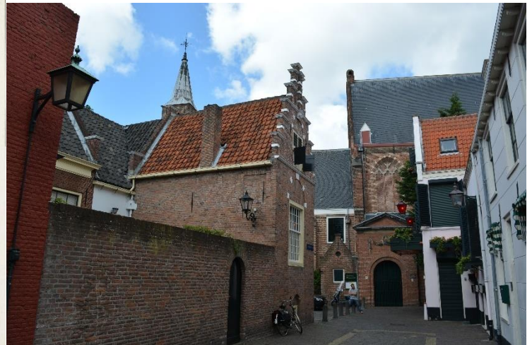
+DSC_6175 ; AV ; 2-7-2017 ; Waalse kerk vanuit de lange Begijnestraat. Een aanzicht als van tekening links is onmogelijk te maken door de aanwezige bebouwing