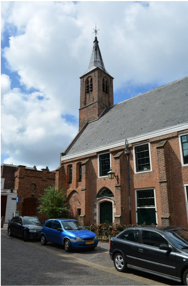
DSC_6707 ; AV ; 2-7-2017 ; Gezicht richting noordwest op de zuidzijde van de Waalse kerk