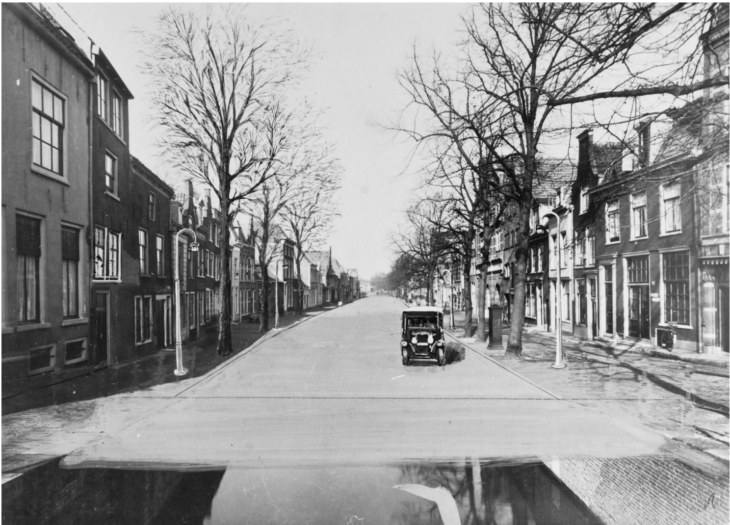
NL-HlmNHA_54023123 ; ? ; 1935 ; Bakenessergracht, aanzicht na mogelijke demping. Gezicht richting noordwest vanaf Spaarne

Sinds kort (juni 2021) is er in een zijgevel van een huis aan de Bakenessergracht een plaquette gewijd aan deze stadslegende.