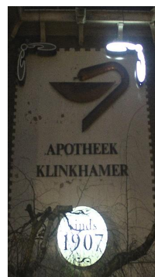
( 2024 – bij avond )

Voor de uitgebreide beschrijving zie de website: homepage , zien , gevelstenen , archief (links onder), alfabetisch