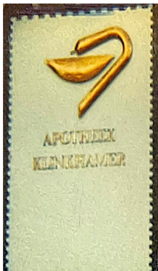
( vóór 1997 )

Het in de buurt zo vertrouwde beeld wordt nog versterkt door de verlichting in de avond. Helaas zijn er een paar delen defect en ook de verf op de muur is in slechte staat. Het zou het stadsbeeld weer verfraaien wanneer de muurreclame een opknapbeurt zou krijgen.