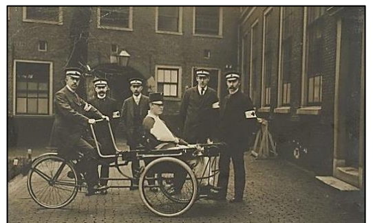
Rode Kruis oefening op de binnenplaats Infirmerie (1912). Foto NHA

Bron: Oude Gebouwen in Haarlem – J.A.G. van der Steur (1907) Noord Hollands Archief