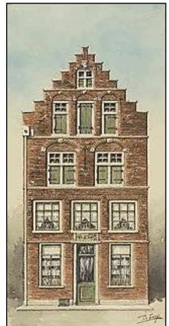
Aquarel door Pieter van Looy

Oude huizen worden vaak vernieuwd, aangepast en zelfs gesloopt. Vaak wordt de gevelsteen dan herplaatst, maar soms is dat niet geval en wordt de steen bewaard. De Stichting Geveltekens Vereniging Haarlem (SGVH) krijgt soms zo'n "weessteen"